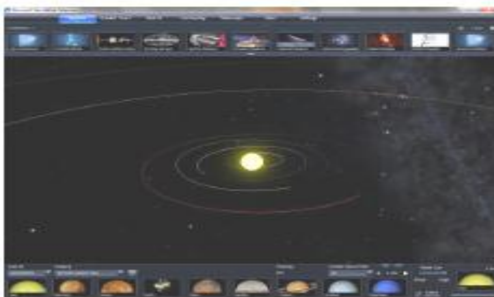
Рис. 3. Вікно програми WorldWideTelescope

Stellarium (рис. 4) – віртуальний планетарій, що містить більш ніж 600 000 зірок у стандартному каталозі програми; планети Сонячної системи з їх головними супутниками; зображення туманностей; Чумацький Шлях; панорамні пейзажі; кульмінації Сонця; затемнення тощо. Передбачено стандартний перспективний, ширококутний (риб'яче око) і сферичний режими проектування; можливість збільшення зображення; управління часом; можливість написання своїх скриптів; управління телескопом; можливість вибору ландшафту або його вимкнення; можливість додавання власних космічних об'єктів, ландшафтів, малюнків сузір'їв.