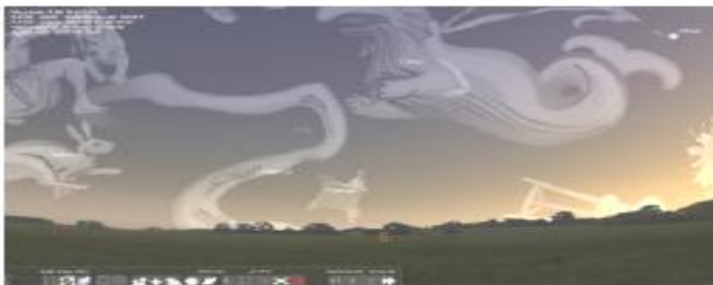
Рис. 4. Вікно програми Stellarium

Stellarium (рис. 4) – віртуальний планетарій, що містить більш ніж 600 000 зірок у стандартному каталозі програми; планети Сонячної системи з їх головними супутниками; зображення туманностей; Чумацький Шлях; панорамні пейзажі; кульмінації Сонця; затемнення тощо. Передбачено стандартний перспективний, ширококутний (риб'яче око) і сферичний режими проектування; можливість збільшення зображення; управління часом; можливість написання своїх скриптів; управління телескопом; можливість вибору ландшафту або його вимкнення; можливість додавання власних космічних об'єктів, ландшафтів, малюнків сузір'їв.