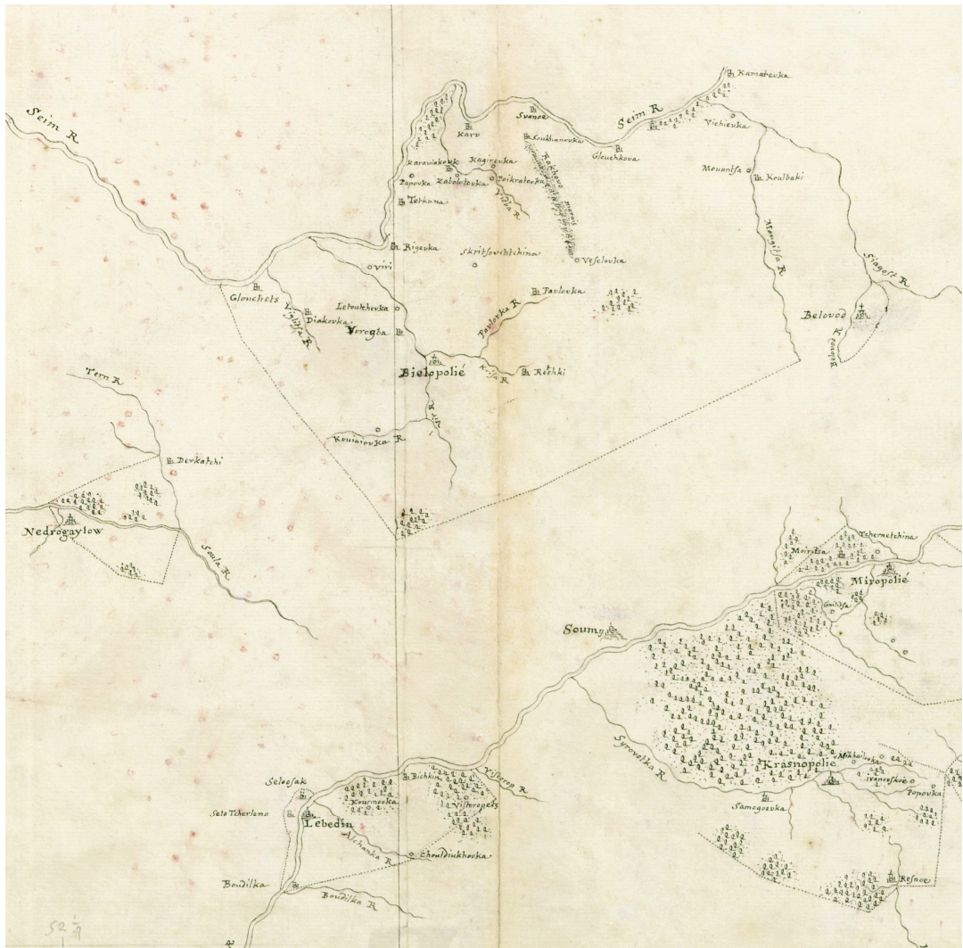
Рис. 1. Фрагмент ландкарти Сумського полку 1725 р. Я. Єсенева з позначенням верхньої течії р. Вир і лісового масиву.

В. Ляскоронський, аналізуючи ці події вважав, що це сталося все ж таки поблизу літописного міста Вир 21 . П. Голубовський, з посиланням на роботи О. Дмитрюкова та архієпископа Філарета, також вважав, що події 1127 р. на р. Локня відбувалися поблизу сучасного міста Суджа. Його робота « Печенеги, торки, половци до нашествия татар » підсумувала та узагальнила тогочасні знання щодо історичної