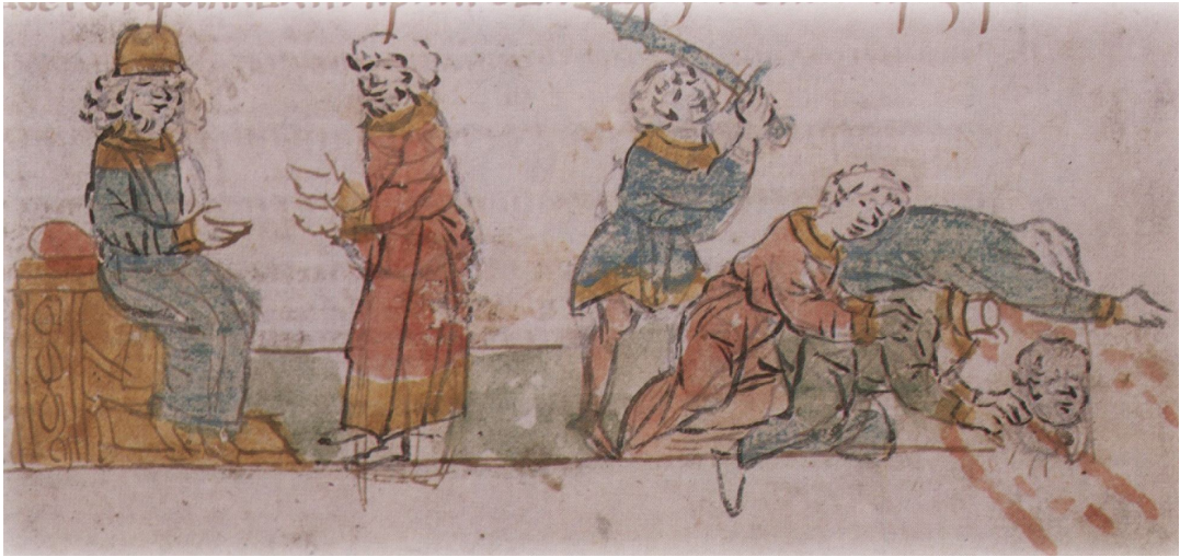
Рис. 3. Вигнання князя Ярослава Всеславом Ольговичем і побиття чернігівської дружини. Мініатюра з Раздивілівського літопису.

де проживало слов'янське населення, але були відсутні прикордонні фортеці. Тут існували невеликі поселення, які були зведені на рештках укріплень-твердей сіверян. Населення середніх течій Псла та Ворскли мали тісні контакти з кочовиками, що підтверджується археологічними матеріалами та особливостями поховального обряду 27 . Вони не були перепорою для просування половецької кінноти, але могли дати звістку про їх появу.