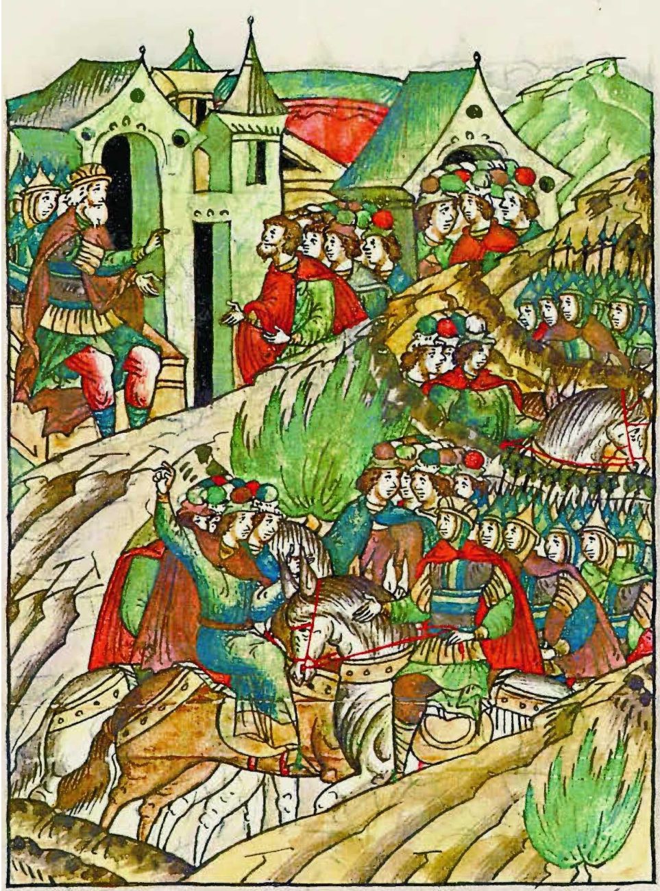
Рис. 4. Затримання половецьких послів на р. Локня. Мініатюра з Лицьового літописного зводу 16 століття.

Рухатися далі на захід половці не наважувалися, адже з півночі знаходилося місто Вир, а з південного заходу – Зартий.