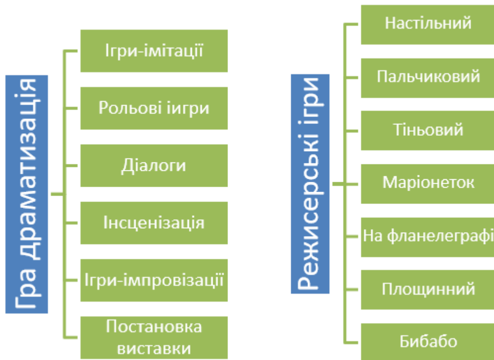
Рис. 1.3 Види театралізованих ігор

У зміст програми з організації театралізованої діяльності в дошкільному навчальному закладі «Грайлик» (авт. О. Березіна, О. Гніровська, Т. Линник) введено ознайомлення з різними видами театрів, використання мімічних і пантонімічних етюдів, етюдів для запам'ятовування мімічних дій; роботу з літературними творами (придумування і оформлення дитячих казок, інтерпретація змісту текстів)[63].