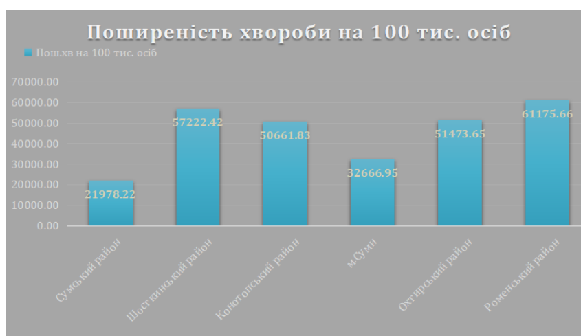
Рис. 1. Поширеність ССЗ серед мешканців Сумської області станом на 01.01.2021 р.

У 2020 році відбулися зміни адміністративно-територіального устрою, результатом яких стало об'єднання 18 районів та утворення 5 нових адміністративно-територіальних одиниць. Ці зміни призвели до змін у чисельності населення, отже змінилися показники первинної захворюваності і поширеності хвороб серед місцевих жителів. Аналіз поширеності хвороб ССЗ у розрізі адміністративних одиниць регіону показав, що найвищий показник загальної захворюваності фіксується у Роменському районі (61175,66 випадків на 100 тис. осіб) (рис. 1). Найнижчі показники має м. Суми (32666,95) та Сумський район (21978,22 випадків на 100 тис. населення).