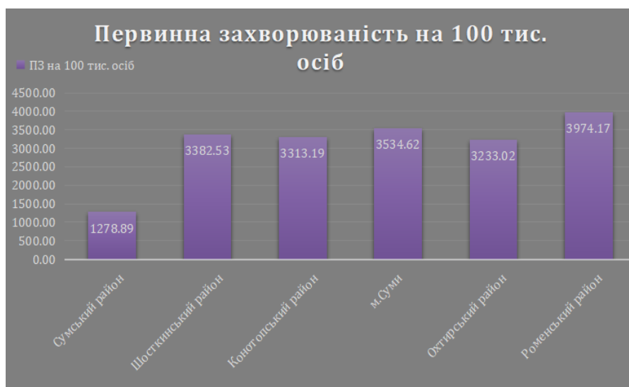
Рис. 2. Первинна захворюваність населення Сумської області на ССЗ станом на 01.01.2021 р.

показник реєструється в Сумському районі – 1278,89 випадків на 100 тис. осіб (рис. 2).