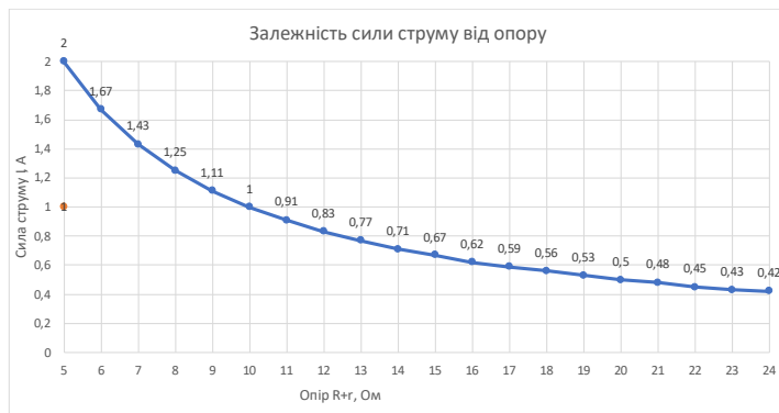
Рис. 2. Залежність сили струму від опору в колі постійного струму

На Рис. 2 згідно закону Ома спостерігаємо нелінійну залежність сили струму від опору . Звичайно це впливає з самої формули, оскільки опір стоїть у знаменнику I = \epsilon / (R+r) .