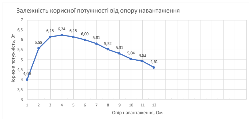
Рис. 3. Залежність корисної потужності від опору навантаження (опору зовнішньої ділянки кола постійного струму)

Графік на Рис. 3 представляє нелінійну залежність P кор (R) . Маємо доволі важливий результат, на особливостях якого необхідно акцентувати увагу здобувачів освіти. Саме в момент, коли опір навантаження зрівнюється з опором джерела струму R=r=4, корисна потужність набуває максимального значення. P_{кор} = I^2 R = \epsilon^2 R / (R+r)^2 .