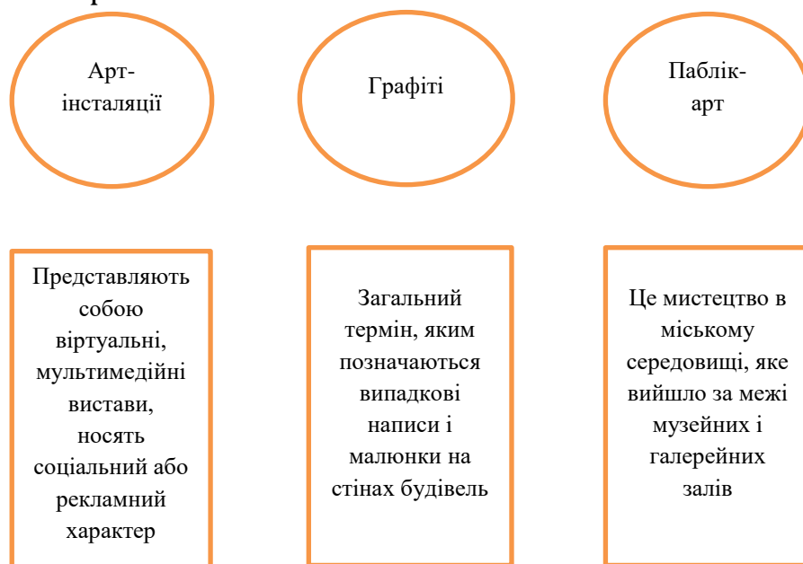
Рис. 1. Класифікація арт-об'єктів у міському середовищі [3]

Так відокремився сегмент арт-туризму, що обумовлено зростанням інтересу туристів як до розкритих, всесвітньо відомих, так і локальних, аматорських арт-об'єктів. Класифікація арт-об'єктів наведена на рис. 1.