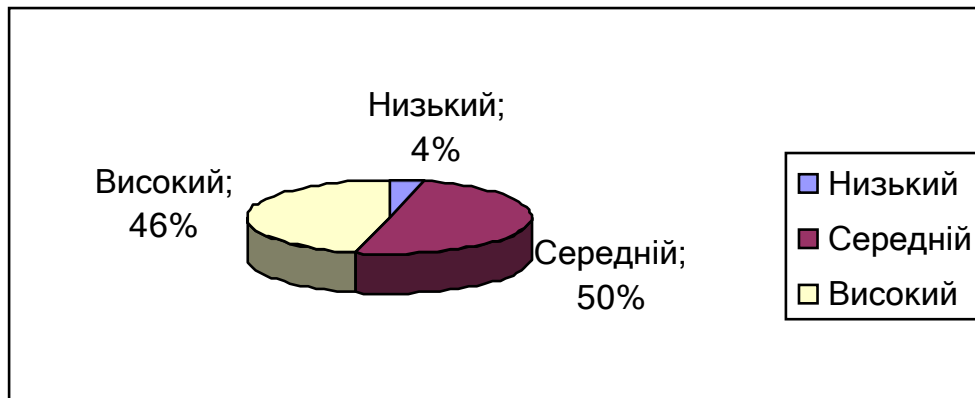
Рис. 2.1.2. Показники рівня опосередкованого запам'ятовування учасників експериментальної групи

Показники рівня опосередкованого запам'ятовування студентів 2-го курсу закладу вищої освіти