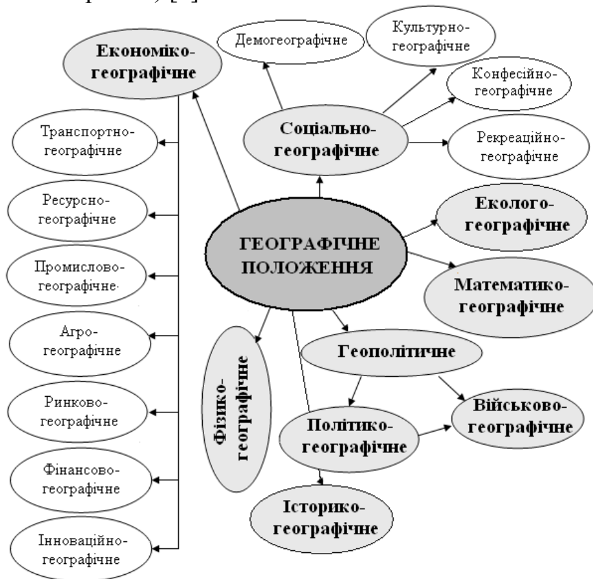
Рис. 1. Географічне положення території (побудовано авторами за [7; 8; 14; 16; 17])

1. За масштабністю охопленої території: макро-, мезо- і мікроположення . Мікроположення характеризує відношення даного об'єкта з найближчим оточенням (локальний рівень), мезоположення – положення в регіоні, країні (регіональний рівень), макроположення – співвідношення об'єкта з великими ділянками географічної оболонки або земної поверхні в цілому (національний та міжнаціональний рівень) [8].