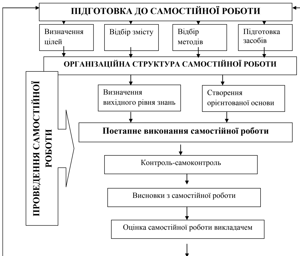
Рис.1. Методична конструкція організації та проведення самостійної роботи студентів за Н. Г. Лукіною [9]

Головною умовою ефективності виконання самостійної роботи визначено системність та регулярність її здійснення студентами, з одного боку, а з іншого – керівництвом, целеспрямованістю й вимогливістю викладацького складу за реалізацією самостійною роботи студентів. Дослідницею Н. Г. Лукіною представлено методичну конструкцію організації і проведення самостійної роботи студентів, яка складається з певних взаємопов'язаних компонентів (див. рис. 1).