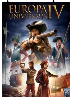
Рис. 3. Обложка видеоигры «Europa Universalis».

флотов и управление ими, дипломатия, внедрение новых технологий, внутренняя политика государства, изменение государственной религии и колонизация новых земель.