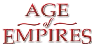
Рис.5. Логотип видеоигры «Age of Empires».

«Age of Empires» – все игры серии посвящены различным историческим эпохам, где игрок развивает цивилизации, проводя их через века для победы над противниками.