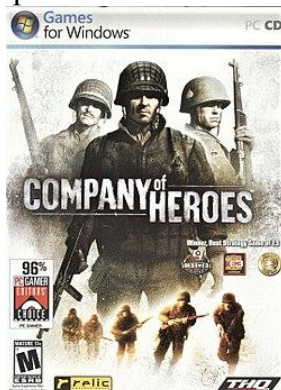
Рис. 8. Обложка видеоигры «Company of Heroes».

«Company of Heroes» – игра посвящена Второй мировой войне, в частности борьбе войск США против сил Вермахта в Европе в течение 1944 года.