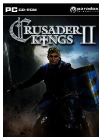
Рис. 4. Обложка видеоигры «Crusader Kings 2».

«Crusader Kings 2» – эта игра моделирует систему феодальных отношений в средневековой Европе и на Ближнем Востоке, включая личные взаимоотношения между тысячами персонажей, войны (в том числе крестовые походы), интриги, борьбу за влияние на папу римского и тому подобное. Сам процесс построен исключительно на игре за выбранную игроком династию.