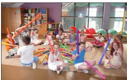
Zdjęcie 2. Muzykowanie z użyciem „Bum-Bum Rurek”