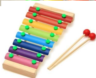
Zdjęcie 5. Diatoniczne dzwonki edukacyjne „kolorowe cymbały”