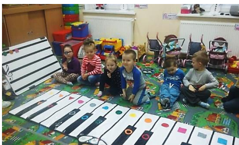
Zdjęcie 1. Zabawa muzyczna z użyciem maty dźwiękowej

obrazujacy zestaw „kolorowych instrumentow” uzytecznych w edukacji muzycznej dziecka