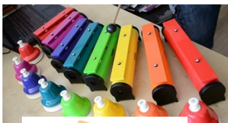
Zdjęcie 4. Dzwonki naciskane i kolorowe sztabki na tubach