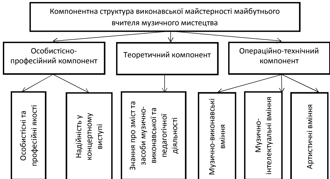
Рис. 1. Компонентна структура виконавської майстерності майбутнього вчителя музики

Стимулювання в наукових працях розглядається як динамічний процес, що передбачає вплив на особистісну (зростання особистісних і професійно важливих якостей), когнітивну (формування широкого спектру теоретичних і практичних знань із музично-педагогічної та виконавської діяльності майбутнього вчителя музики), операційно-технічну (виконавські вміння) сфери студента. Важливо зазначити, що процес стимулювання мотиваційної сфери має здійснюватися відповідно до структури виконавської майстерності майбутнього вчителя музики, що представлена на рис. 1.