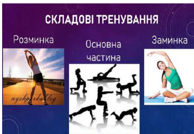
Рис. 4. Компоненти заняття фізичними вправами

Фізичні вправи є одним з найбільш біологічно обґрунтованих засобів, що забезпечує природну потребу організму в руховій активності, профілактику та лікування захворювань, відновлення працездатності фахівців. Оздоровчі (тренувальні) заняття повинні мати комплексний характер, тобто сприяти розвитку фізичних якостей, зміцнювати здоров'я і підтримувати загальну працездатність організму. Оздоровчі заняття фізичними вправами мають складатися із вступної частини (розминки), основної частини заняття та заключної частини заняття (заминки) (рис. 4). Для вступної частини характерні тонізуючі вправи, що сприяють поступовій адаптації організму до фізичних навантажень. Для основної частини слід підбирати швидко-силові вправи, з елементами спортивних ігор, що активізують стан усіх систем організму. Для заключної частини слід добирати дихальні психотонічні вправи (рис. 5).