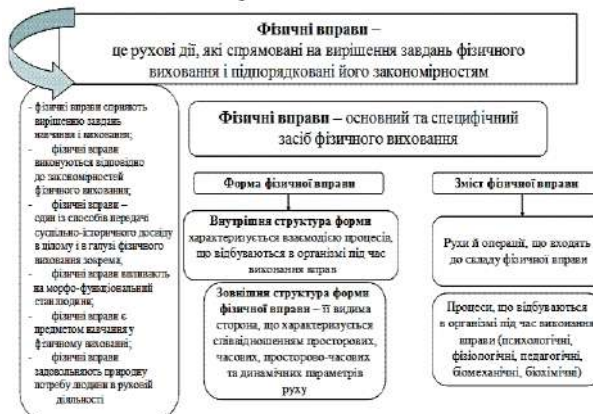
Рис. 2. Форма та зміст фізичної вправи