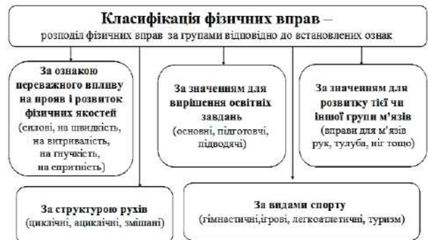
Рис. 3. Класифікація фізичних вправ

Застосування програмного забезпечення, наприклад, Інтернет-ресурсу з біомеханіки, допоможе майбутнім фахівцям з фізичної культури та спорту вивчити біомеханічні основи рухової діяльності людини, а також педагогічні засоби і методи її оптимізації з метою удосконалення рухових дій для досягнення запланованих результатів у фізичному вихованні, спорті, а також у фізичній реабілітації та рекреації. Як бачимо, виконання рухових дій доцільно доповнювати використанням відповідних інформаційних ресурсів.