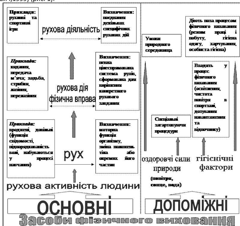
Рис. 1. Основні та допоміжні засоби фізичного виховання

Рухова активність людини передбачає виконання окремих рухів, рухових дій та цілісної рухової діяльності. Рух – це моторна функція організму, що виражається у зміні положень тіла або окремих його частин. Розрізняють вроджені і довільні рухи (Круцевич,1999) (рис. 1).