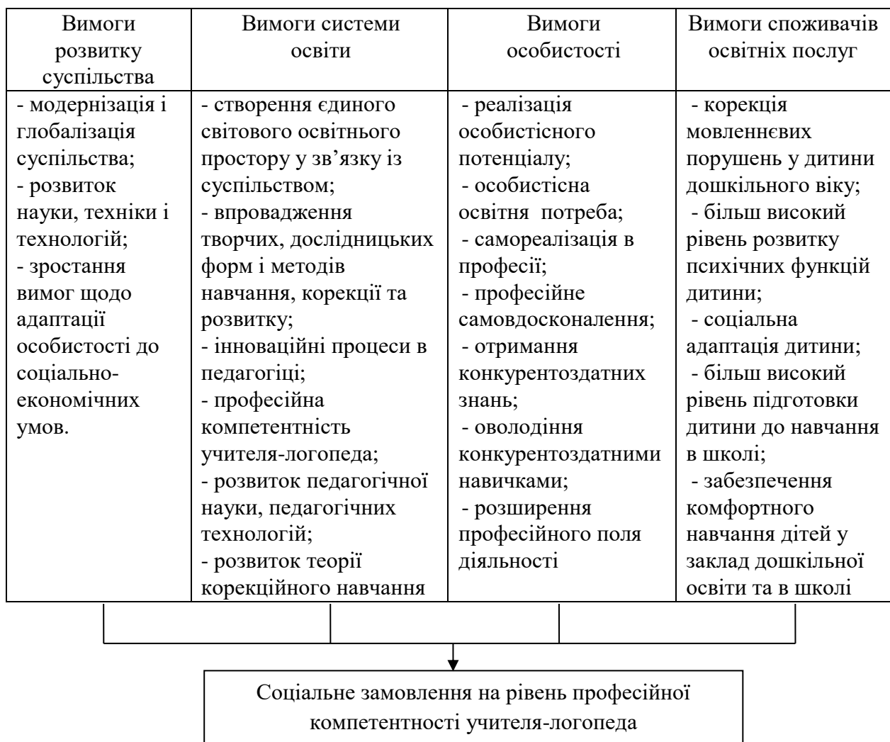
Рис. 1. Система вимог до рівня сформованості професійної компетентності спеціаліста корекційної педагогіки.

За ідеєю української педагогічної спадщини Г. Г. Ващенко, професійна компетентність розуміється як педагогічна майстерність – показник високої професійної діяльності: глибока освіченість людини, всебічний розвиток з історії педагогіки, філософії, тому що всі педагогічні системи базуються на певних філософських засадах [1].