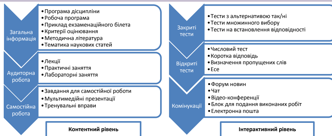
Рис. 1. Наповненість сторінки ПНС за кожною навчальною дисципліною математичного циклу