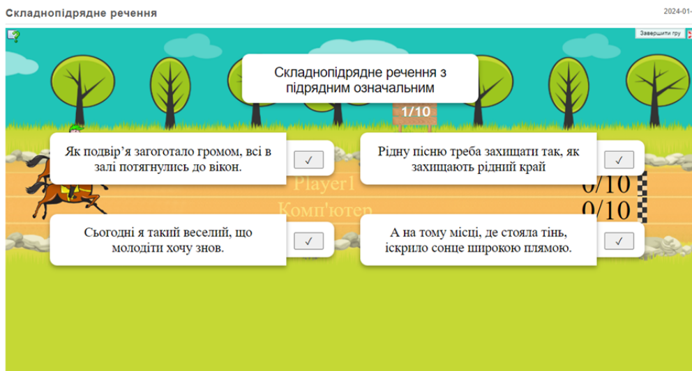
Рис. 4. Вправа «Складнопідрядне речення» з онлайн-сервісу LearningApps

Вправа виконана в шаблоні «Скачки» передбачає гру двох учасників у вигляді змагання. У кожного гравця є власний кінь, який спрямовує його до перемоги шляхом обрання правильної відповіді. У даній грі складено одинадцять (шаблон дозволяє створити необмежену кількість) завдань з варіантами відповідей. Запитання стосуються теми «Речення». Після того, як один гравець обрав відповідь, хід переходить до іншого учасника.