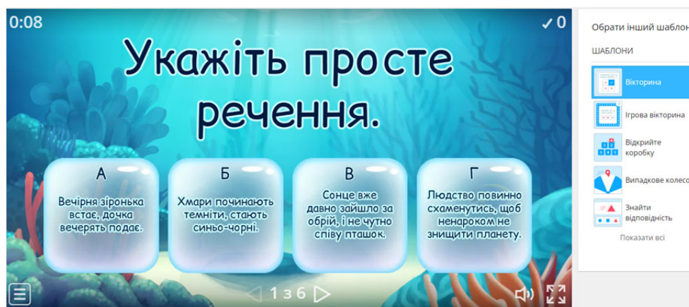
Рис. 2. Вправа «Синтаксис» (повторення) з онлайн-сервісу Wordwall

Дана вправа побудована в тестовій формі. У кожному завданні висвітлено запитання, яке стосується синтаксису та представлено по 4 варіанти відповідей. Учні необхідно обрати правильну шляхом натискання на віконце. У вправі фіксується витрачений час на виконання завдання й кількість отриманих балів. Подібні завдання найкраще пропонувати учням в індивідуальному порядку, щоб підготувати їх до діагностичної роботи або просто закріпити знання. Вправа представлена на рис. 2. та за посиланням вище.