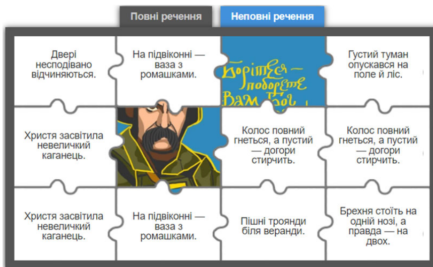
Рис. 3. Вправа «Повні й неповні речення» в онлайн-сервісі LearningApps

Дане завдання виконане в шаблоні «Пазл» (рис. 3). Подані у вправі речення поділені на дві категорії: повні й неповні речення. Полотно, під яким заховалася картинка з висловом Т. Шевченка, поділено на невеликі частинки – пазли, на кожному з яких написано речення. Щоб віднести речення до певної категорії, необхідно натиснути зверху полотна на потрібний напис, а потім на конкретний пазл. Якщо міркування учня правильні, то він зникає; якщо навпаки, то відкривається вікно з поясненням, що необхідно подумати краще.