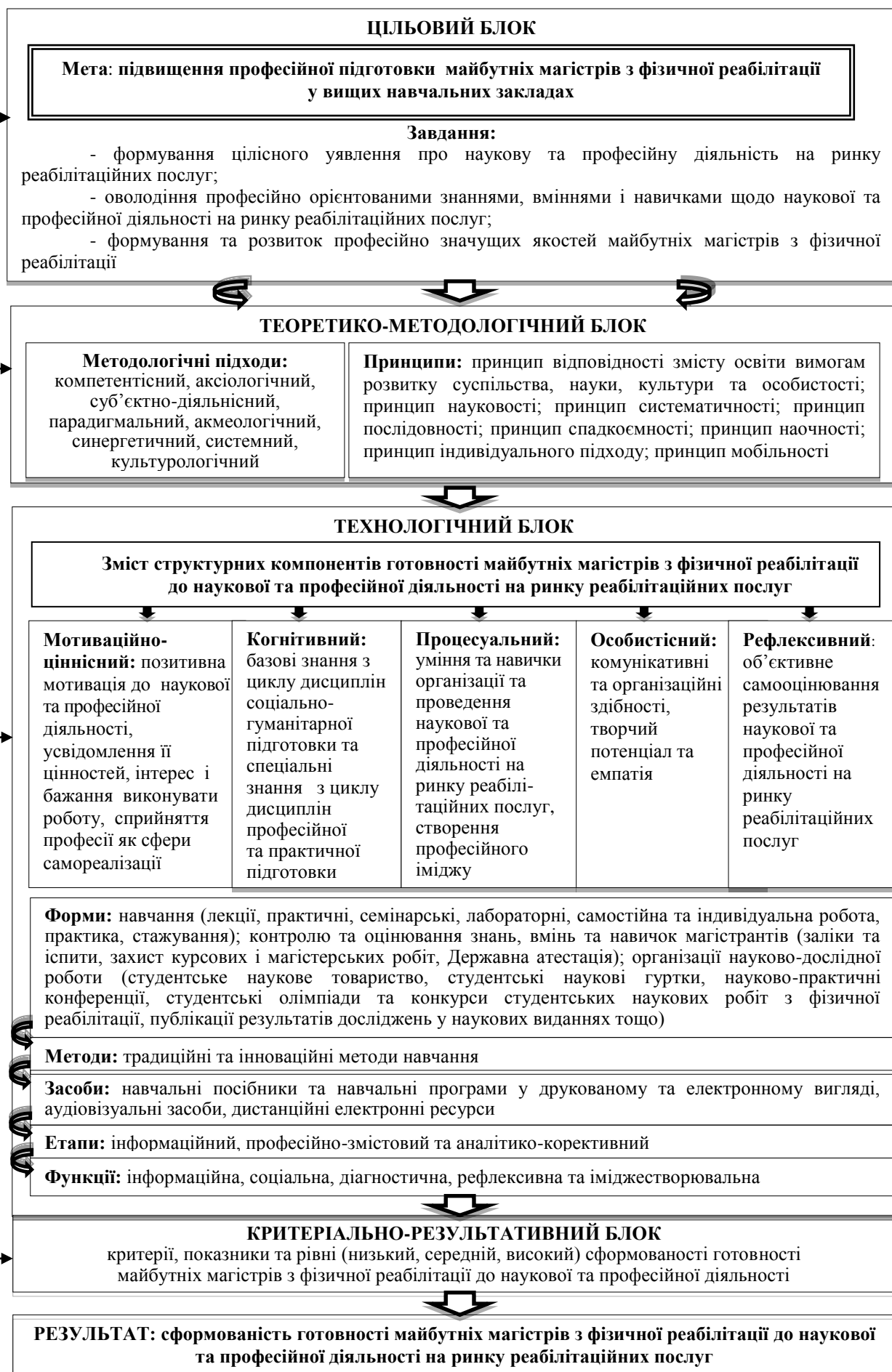
Рис. 1. Модель професійної підготовки майбутніх магістрів з фізичної реабілітації у вищих навчальних закладах

Педагогічні умови: трансформація змісту вищої освіти майбутніх магістрів з фізичної реабілітації з урахуванням особливостей наукової та професійної діяльності на ринку реабілітаційних послуг; формування ціннісного ставлення магістрантів до наукової та професійної діяльності у процесі впровадження інноваційних освітніх технологій; застосування сучасних інформаційно-комунікаційних технологій у навчально-виховному процесі; розвиток досвіду роботи у мультидисциплінарній команді в процесі проведення виробничих практик і науково-дослідної роботи магістрантів