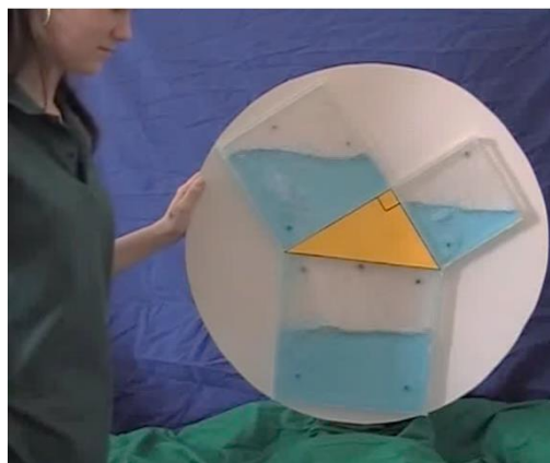
Рис. 3. Наглядная теорема Пифагора

Например, на рис. 3 представлен известный в Интернет-пространстве видеоклип, показывающий наглядно смысл теоремы Пифагора, с помощью переливания. Это видео https://youtu.be/CAkMUdeB06o достаточно популярно и получило немало положительных отзывов.