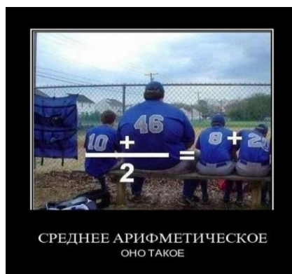
Рис. 4. Математический юмор из Интернета

Количество комментариев – посетители странички высказывают свое мнение и показывают свой интерес и отношение к данному посту. В обучении особенно полезно использование дискуссии, которая записана и любой участник группы в любое время может проследить ее логику. Отдельно сам учитель может дать указания и похвалить школьников. Риски кроются в том, что если поставлена задача, школьники увидят ответы, поставленные предыдущими пользователями и возможно скопируют их. С другой стороны, учитель может учесть только первый правильный ответ. Тут можно организовать и вложенные комментарии, если в ходе основного вопроса появятся интересные темы обсуждения.