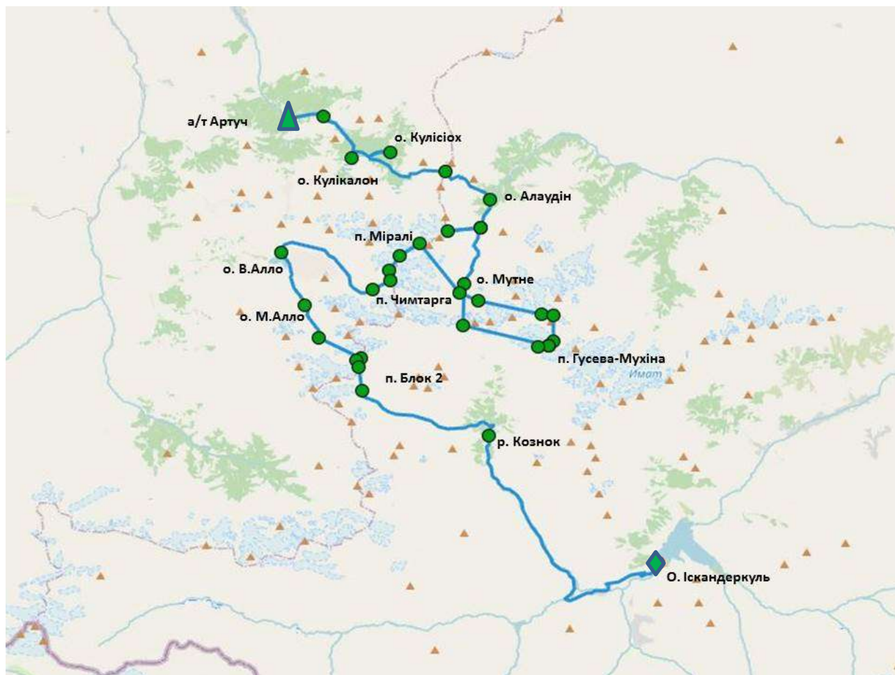
Схема маршруту 5-ї категорії складності в Фанських горах.