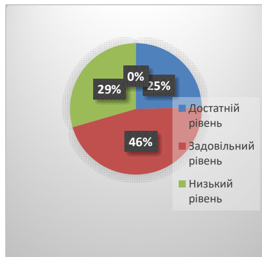
Рис. 2. Динаміка рівнів сформованості комунікативної компетентності майбутніх фахівців соціономічної сфери за результатами констатувального і прикінцевого етапів експерименту (у %)

Як видно з рис. 2., у рівнях сформованості комунікативної компетентності майбутніх фахівців соціономічної сфери експериментальної групи відбулися відчутні зміни внаслідок проведення цілеспрямованої роботи: на достатньому рівні результати збільшилися на 20,0%, на задовільному рівні – на 2,5%, на низькому рівні результати зменшилися на 22,5%.