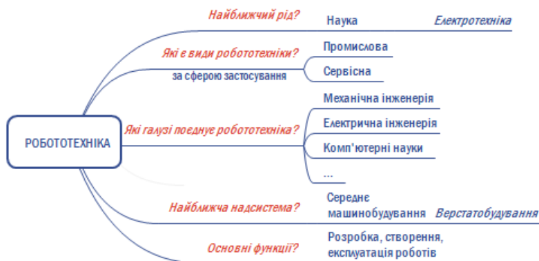
Рис. 6. Структура смислового змісту терміна «робототехніка»

Інтелект-карта на рис. 6 відображає шукану структуру. Варто зазначити, що це один із можливих варіантів структурування смислового змісту терміна «робототехніка».