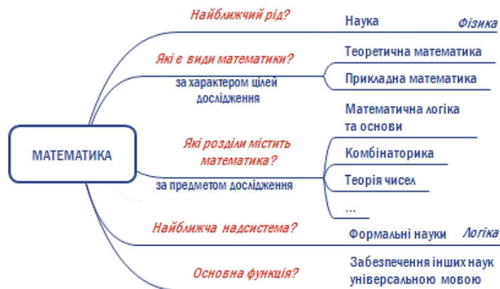
Рис. 5. Структура смислового змісту терміна «математика»

Інтелект-карта на рис. 5 зображує шукану структуру. Варто зазначити, що це один із можливих варіантів структурування смислового змісту терміна «математика».