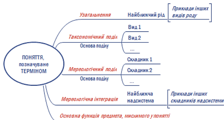
Рис. 4. Формалізований опис запропонованої тактики засвоєння терміна

призводить до помилки «стрибок узагальнення». Це порушення послідовності узагальнення, коли пропускається проміжний рід. Наприклад: ромб — це чотирикутник (пропущеним є проміжний рід «паралелограм»). Своєрідною перевіркою правильності виведення родового поняття є наведення прикладів видових понять, що входять до його обсягу.