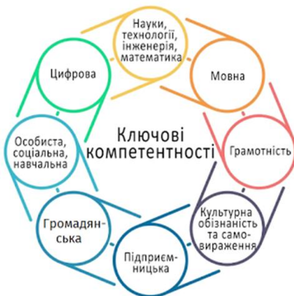
Рис. 1.1 окреслює усі ключові компетентності, які мають бути опановані під час навчання протягом життя.

Підприємницька компетентність є однією із ключових компетентностей, які виступають як знання, уміння, навички, цінності, що становлять особистісні та суспільні погляди на життя та діяльність. Компетентнісний підхід в сучасній освіті наразі є затребуваним, адже він передбачає особистісно орієнтоване навчання, спрямоване на розвиток індивідуальних рис дитини, самовизначення, самореалізацію та соціалізацію у суспільстві.