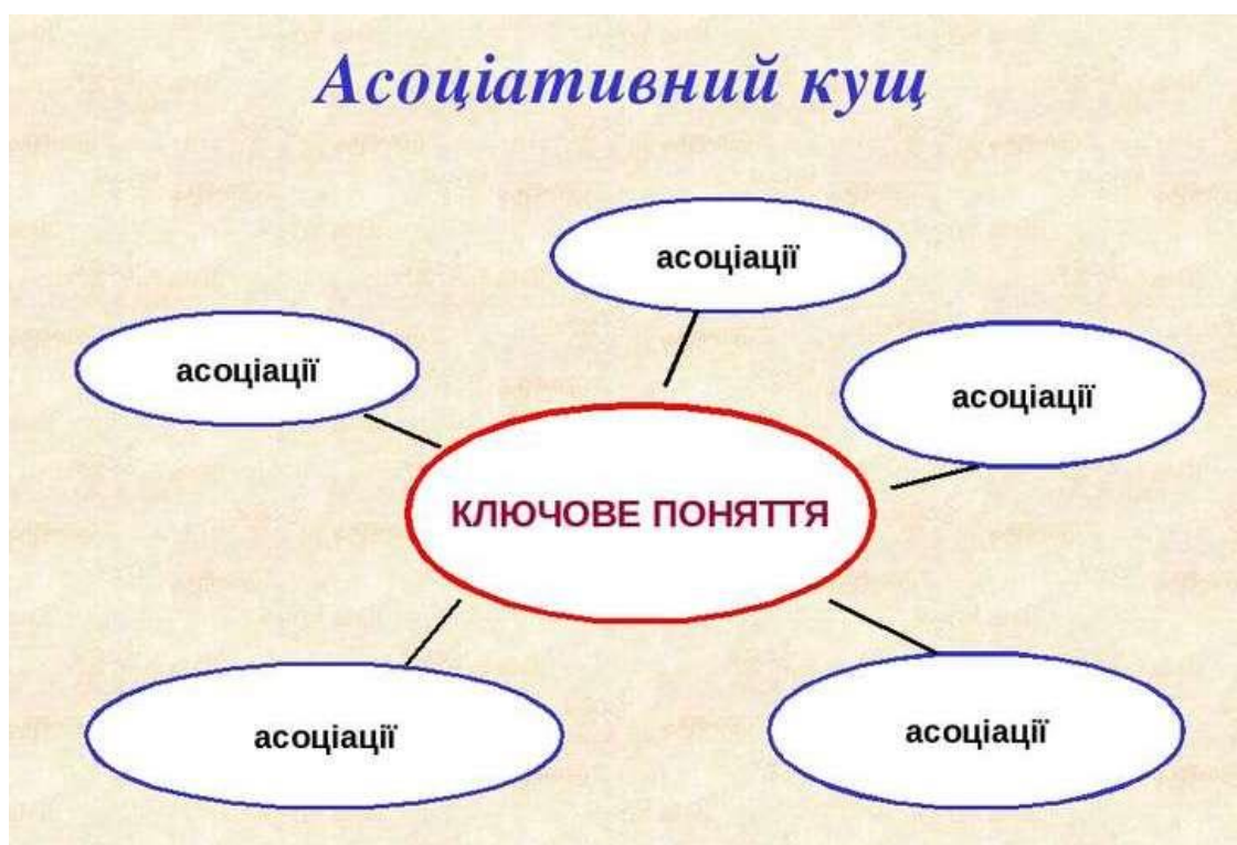
Рис. 2.2. Вправа «Асоціативний куц»

7) практичний прийом «Storytelling», який спрямований на розвиток мовних та мовленнєвих навичок та на самостійний пошуку вирішення поставлених цілей на занятті (Красовська, 2014).