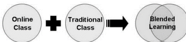
Рис. 1. Змішане навчальне середовище

Відповідно до цього відбувається стрімкий розвиток створення програмних комплексів e-learning різної спрямованості, у тому числі систем доставки контенту, організації й управління навчальним процесом. У зв'язку з розвитком e-learning визначився новий напрям – «змішане навчання» (ЗН) (blended learning). Maryam Tayebinik подає таку графічну форму змішаного навчального середовища (Рис. 1):