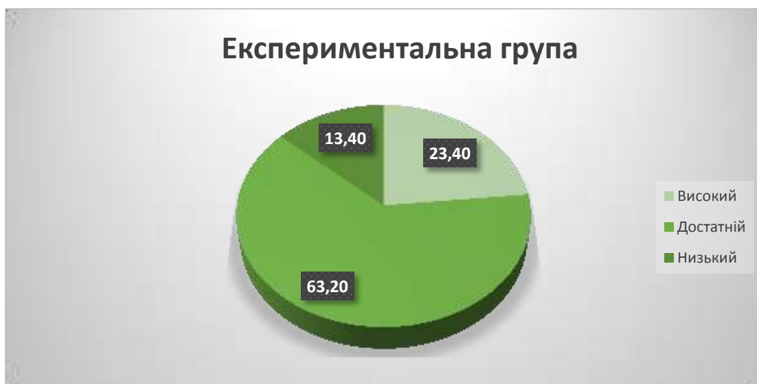
Рис. 2.3. Загальний рівень виховання самостійності дітей експериментальної групи в ігровій діяльності

Отже, з досліджень зроблено висновок, що діти експериментальної групи показали значно кращий рівень виховання самостійності, що свідчить про ефективність впровадження в ігрову діяльність вищезазначених педагогічних умов. Як свідчать результати, в експериментальній групі порівняно з контрольною має місце збільшення чисельності дітей, яким властивий високий та середній рівень самостійності, та зменшення кількості дітей з низьким рівнем. В той час, як у контрольному класі результати майже не змінилися.