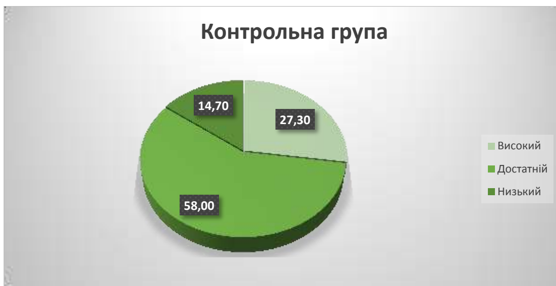
Рис. 2.2. Загальний рівень виховання самостійності дітей контрольної групи в ігровій діяльності