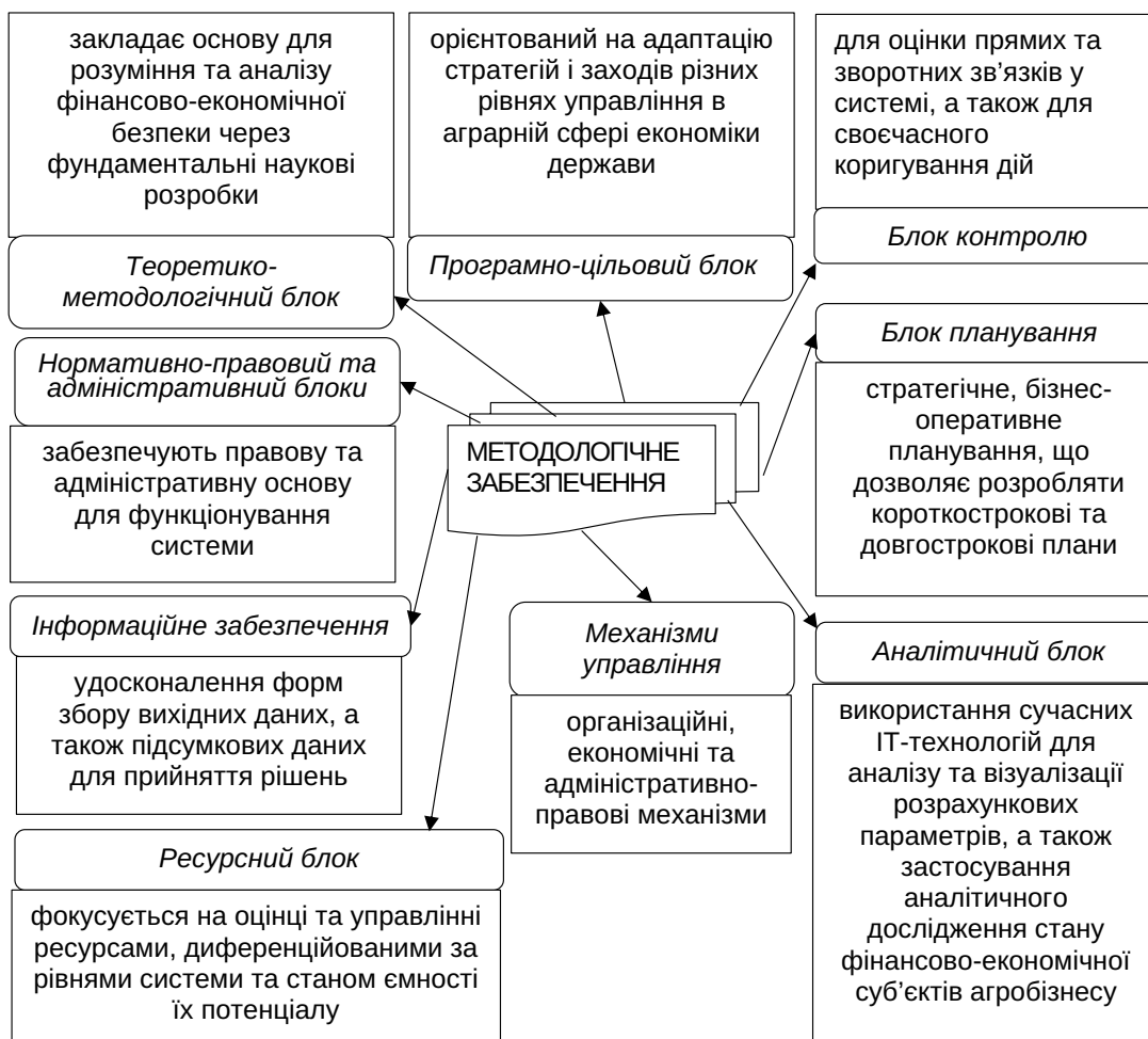
Рис. 2. Система методологічного забезпечення фінансово-економічної безпеки суб'єктів агробізнесу

Таким чином, стратегія забезпечення фінансово-економічної безпеки суб'єктів агробізнесу на національному рівні – це системно розроблені, науково обґрунтовані та узгоджені з державними пріоритетами напрями, механізми і заходи довгострокової дії, спрямовані на формування стійкої та захищеної фінансово-економічної основи функціонування аграрного сектору. Така стратегія охоплюють комплекс інституційних, фінансових, правових, організаційних та інвестиційних інструментів, які забезпечують мінімізацію внутрішніх і зовнішніх ризиків, стабілізацію грошових потоків, підвищення платоспроможності та інвестиційної привабливості аграрних товаровиробників, а також зміцнення їхньої конкурентоспроможності на внутрішніх і зовнішніх ринках. Вона передбачає