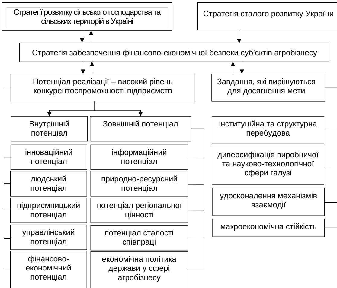
Рис. 3. Елементи стратегії забезпечення фінансово-економічної безпеки суб'єктів агробізнесу на національному рівні