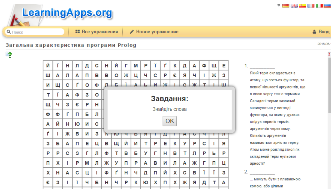
Рис. 2. Тест на тему «Загальна характеристика програми Prolog»