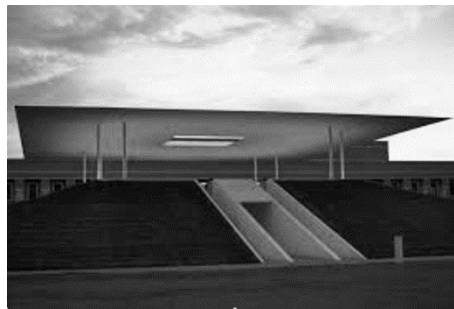
Рис. 4. – Д. Тарелл «Сутінкове Богоявлення» (2012), університет Вільяма Марша Райса, м. Х'юстон, шт. Техас, США.

протилежних сторонах, які являють собою білий бетонний портал, що розсікає піраміду по вертикалі. Рівний простір навколо піраміди, так само покритий газоном, дозволяє сковзати погляду деякий час по зеленій поверхні й зупинитися на «літаючій тарілці» (даху «skyspaces») – акценті даного простору. Для глядачів зазначено, що найбільш вражаюче видовище виникає за сорок хвилин до сходу сонця й за сорок хвилин після заходу сонця, коли виникає перетворення між світлом і темрявою на небі вгорі. Щодо значущості цього об'єкта сучасного мистецтва, то в новинах було написано: «Інсталяція в університетському містечку буде служити місії університету надихати своїх студентів, відповідно до девізу школи «нетрадиційної мудрості»» (James Turrell's «Twilight Epiphany») (рис. 4).