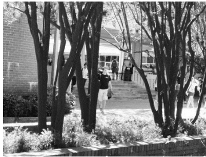
Рис. 5. – К. Дімопулос «Сині дерева» 2012 р., університет Флориди, м. Гейнсвілл, шт. Флорида, США.

залишилося в пам'яті людей, що бачили їх. Також важливо, що цю подію задокументовано на фото (рис. 5).