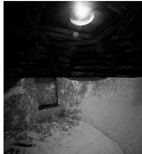
Рис. 3.А – К. Друрі «Зоряна палата», 2006 р., м. Нашвілл, шт. Теннессі, США.