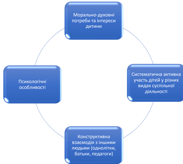
Рис. 1.2. Психолого-педагогічні особливості формування громадянської компетентності молодших школярів

Отже, особливості процесу формування громадянської компетентності молодших школярів ми можемо вбачати в набутті знань соціального та громадянського змісту в різних видах діяльності та умінь перетворювати ці знання в результаті критичного мислення, задоволення потреб і інтересів на власні цінності, установки та орієнтації, які є базою для розуміння важливості певних суспільних явищ.