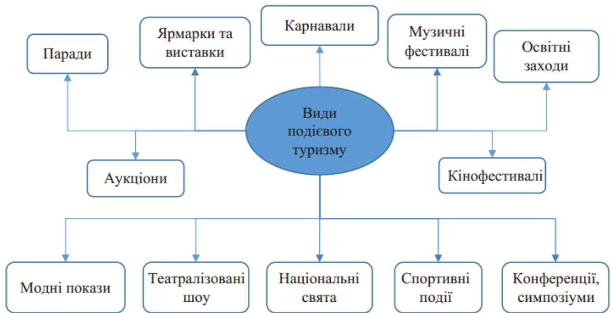
Рис. 1.1. Види подієвого туризму за тематикою заходу

Тож можемо подієвий туризм класифікувати за такими критеріями: