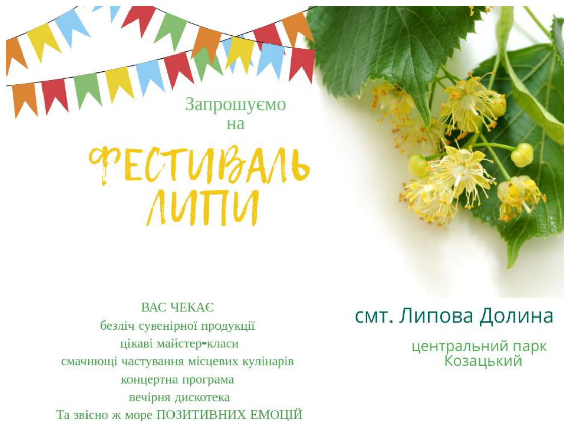
Рис. 3.1 Приклад запропонованого рекламного банеру для «Фестивалю Липи»