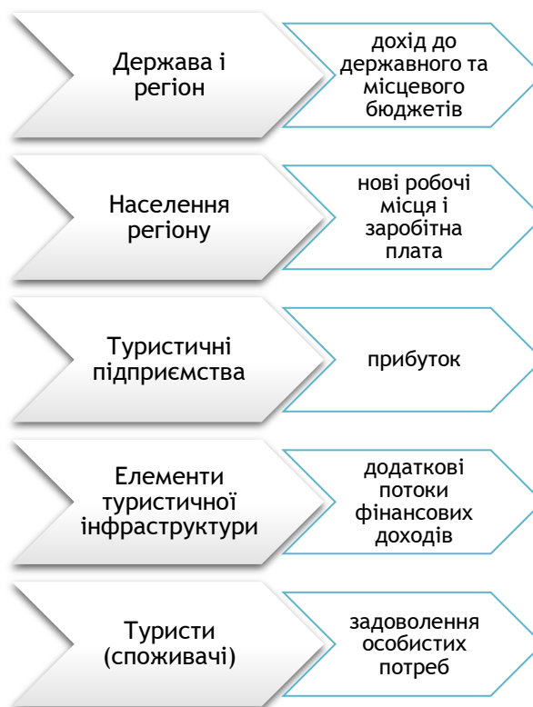
Рис. 2.2. Соціально-економічні ефекти від розвитку подієвого туризму

Розглядаючи подію як окремий туристичний ресурс можемо сказати, що вона може мати яскраво виражений мультиплікаційний ефект, адже спонукає до розвитку й інші сектори туристично індустрії, а якщо мова йде про подію масштабну, міжнародного або національного рівня, то вона спонукає розвиток не тільки туристичної індустрії, а й суміжних, зокрема інфраструктури, і при цьому здійснюється надходження прибутків від туризму. Тож користь від розвитку подієвого туризму отримують всі суб'єкти (рис. 2.1.)