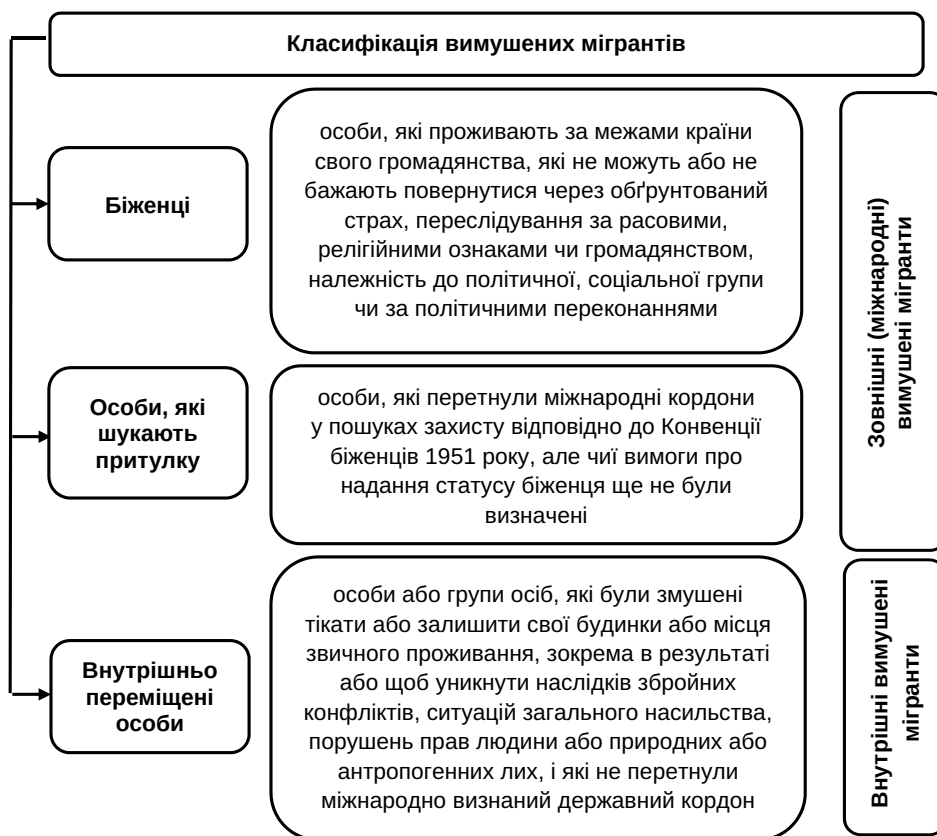
Рис.1. Класифікація вимушених мігрантів

В різних джерелах можна побачити відмінні визначення поняття «внутрішньо переміщена особа». В табл 1 наведено підходи до визначення даної категорії.