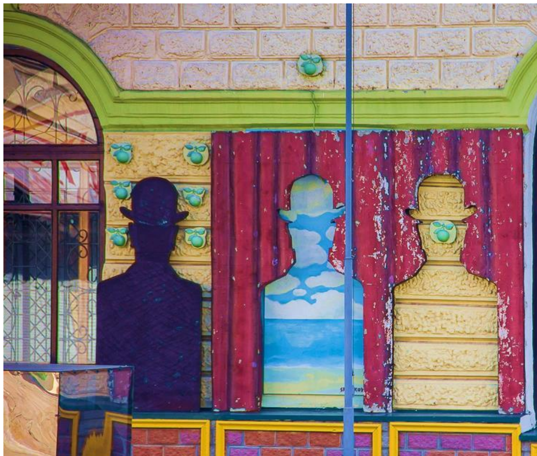
Рисунок А.13 Мурал «Яблука і джентльмени»