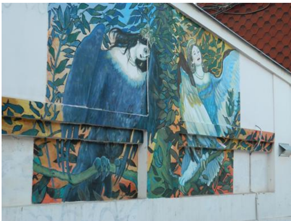
Рисунок А.4 Мурал «Сірін та Алконост. Пісня радості та смутку»