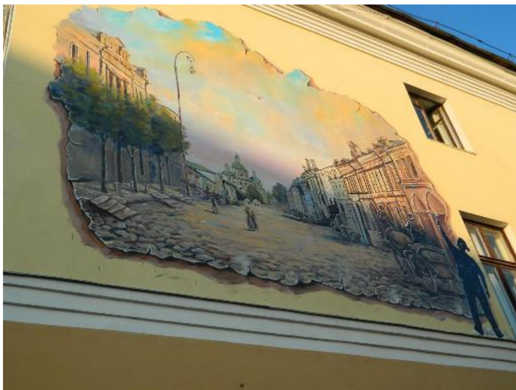
Рисунок А.9 Мурал «Листівка»