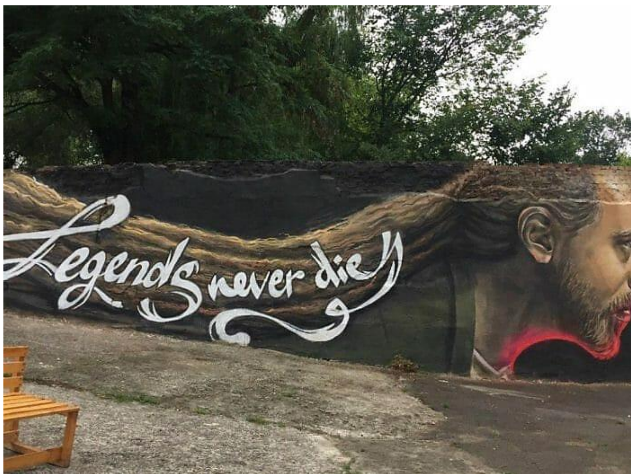
Рисунок А.16 «Децл»