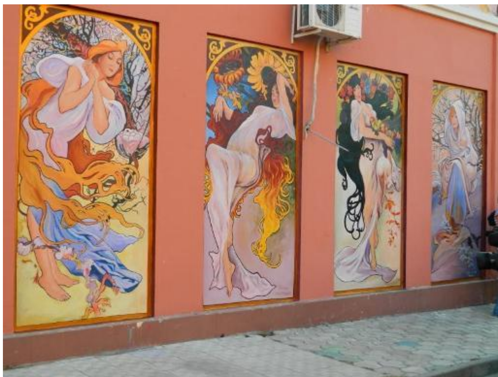
Рисунок А.8 Мурал «Пори року»