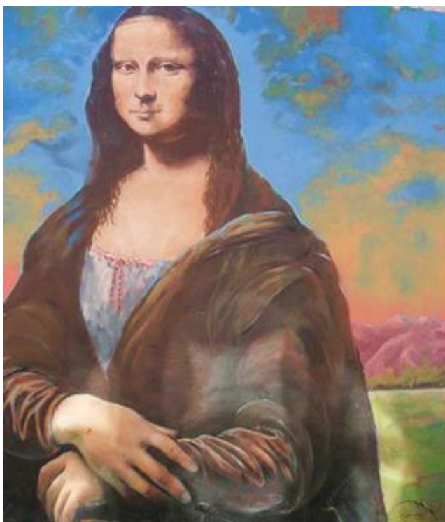
Рисунок А.1 Мурал «Мона Ліза»