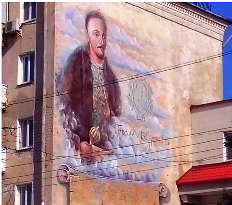
Рисунок А.15. «Перший сумчанин»