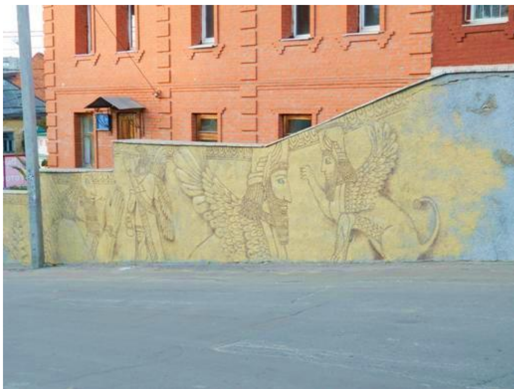
Рисунок А.2 Мурал «Вавилон»