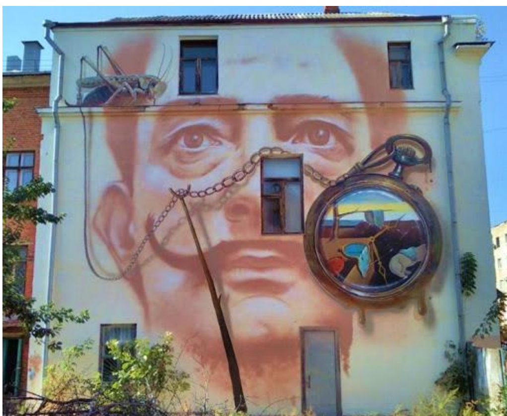
Рисунок А.12 Мурал «Сальвадор Далі»