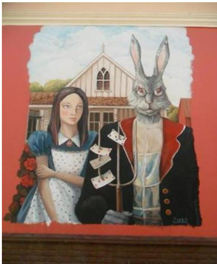
Рисунок А.3 Мурал «Аліса в країні див. Американська готика»