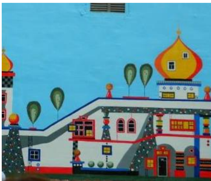
Рис. А.6 Мурал «Архітектурні фантазії»