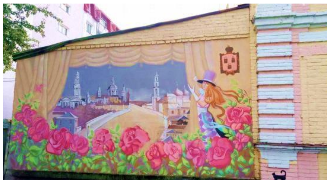
Рисунок А.14 «Міський пейзаж»