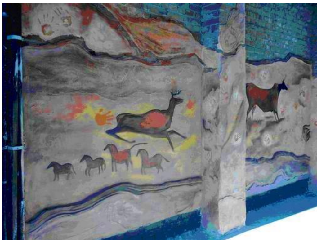
Рисунок А.10 Мурал «Наскальний живопис»