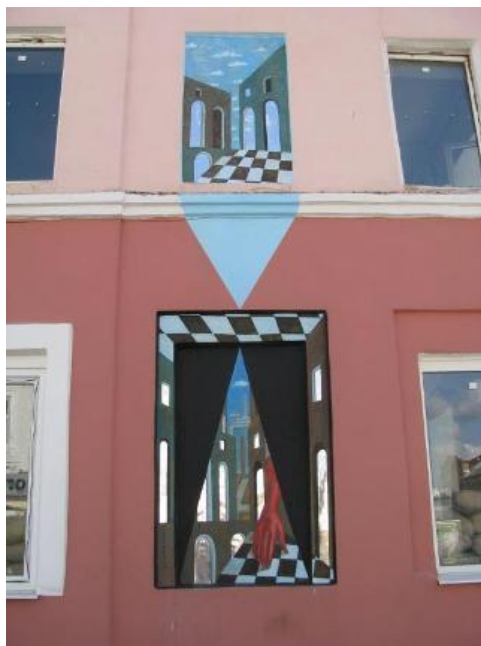
Рисунок А.7 «Метафізичний трикутник»