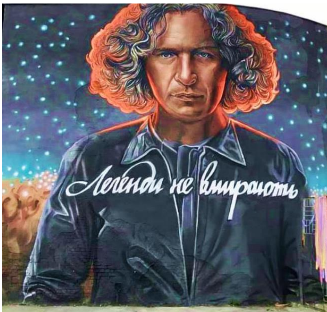
Рисунок А.17 «Кузьма Скрябін»