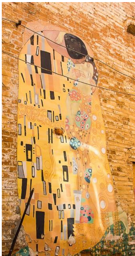
Рисунок А.5 Мурал «Поцілунок»