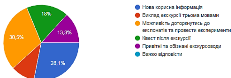
Рис. 5. Діаграма розподілу відповідей респондентів на поставлене запитання