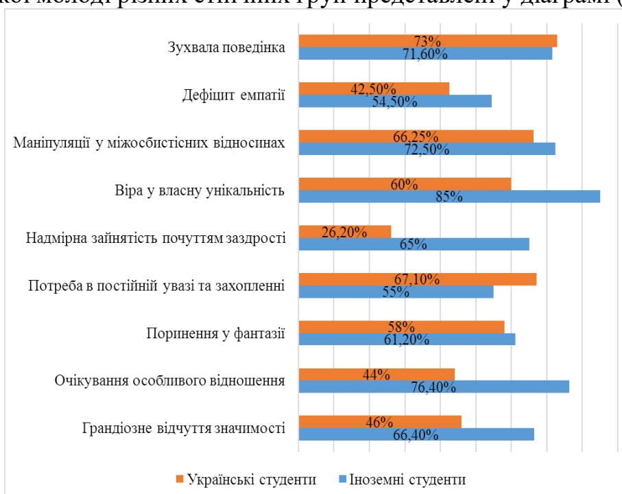
Рис.3. Середньогрупові показники вираженості нарцисичних рис у вибірці студентів-іноземців та українських студентів (За шкалами методики «Нарцисичні риси особистості»)

Кількісні результати аналізу переважаючих нарцисичних рис у студентської молоді різних етнічних груп представлені у діаграмі (рис. 3).