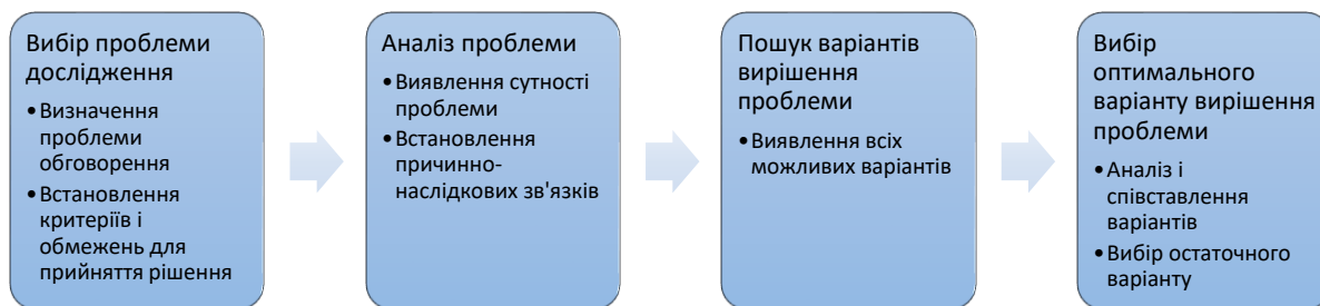
Рис 1. Етапи фасилітації у навчанні

Загальна схема реалізації фасилітаційного підходу у навчанні подана на рис. 1.