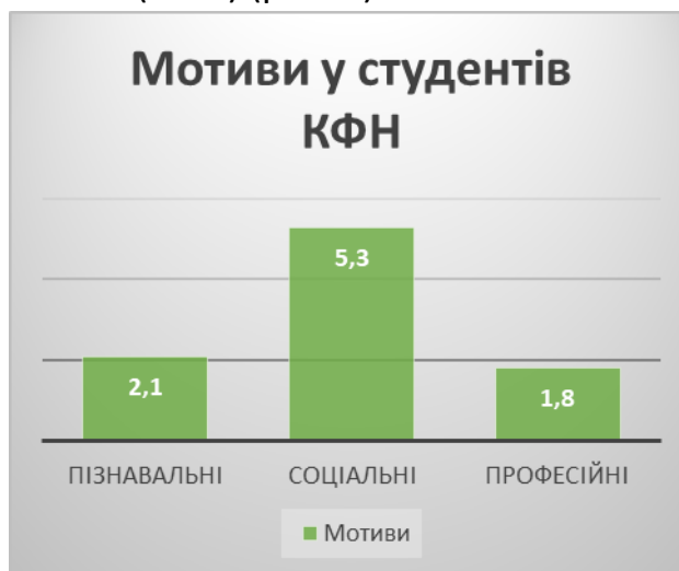
Рис 3. Структура мотивів навчальної діяльності студентів державної форми навчання