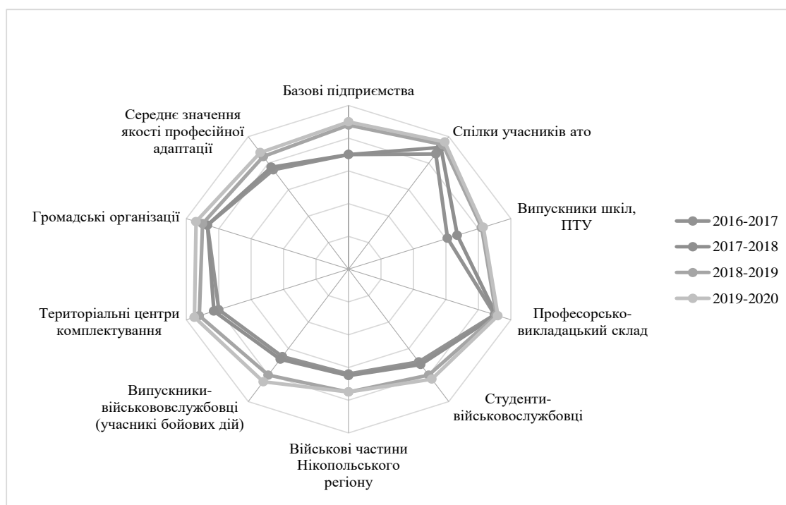
Рис. 3. Результати моніторингу механізму корегування професійної адаптації до професійної продуктивної діяльності

Необхідно відзначити, що дана побудована система моніторингу максимально спрямована на розв'язання основних задач Нікопольського факультету НМетАУ – забезпечення й покращення якості навчально-виробничої роботи, координування зусиль учасників соціального партнерства в забезпеченні гарантії якості професійної адаптації конкурентоспроможних студентів-учасників бойових дій відповідно до сучасних вимог роботодавців.