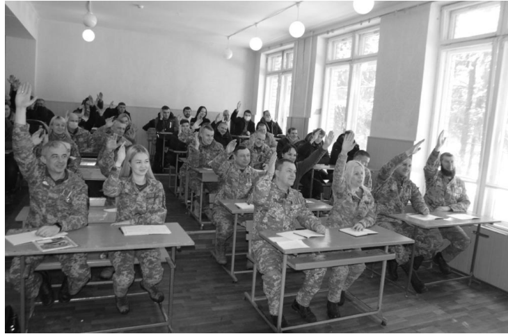
Рис 2. Студенти-учасники бойових дій під час проведення навчальних занять, лютий 2021 р.

Відповідно до виконання Договорів про соціальне партнерство між Нікопольським факультетом НМетАУ та базовими підприємствами, у нашому дослідженні щорічно проводимо моніторинг визначення оцінки задоволення роботодавців освітньою діяльністю Нікопольського факультету НМетАУ. Мета даного моніторингу є неперервне вимірювання сучасних вимог роботодавців для керування якістю навчально-виробничого процесу. На факультеті формується механізм корегування професійної адаптації студентів-військовослужбовців, урахуваючи відгуки роботодавців, випускників, студентів-військовослужбовців (учасників бойових дій), абітурієнтів, батьків та ін. Результати моніторингу «Якість професійної адаптації студентів-військовослужбовців» можна розглянути в динаміці з 75 % до 88 % за 4 роки (рис. 3).