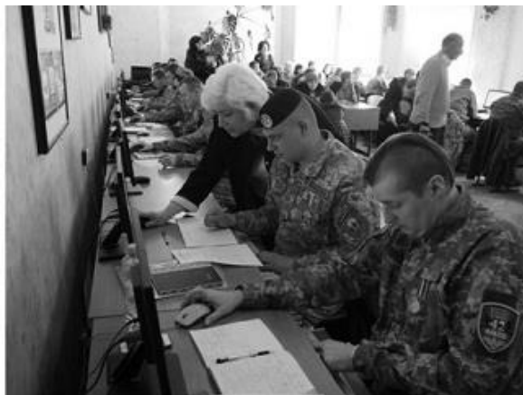
Рис. 5. Обласне відкрите навчальне заняття з вищої математики з використанням математичного пакета MathCad на базі гр. ME915-17H студентів-учасників бойових дій

скорегована з урахуванням вимог роботодавця. Досягти оптимального рівня професійної адаптації студентів-військовослужбовців можливо, коли стає успішним вирішення завдань навчально-виховного процесу.