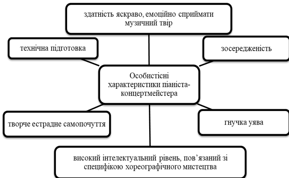
Рис. 2 Основні характеристики, які визначають майстерність концертмейстера балетного класу.

Концертмейстерська діяльність, пов'язана з мистецтвом хореографії, як і будь-який інший вид професійної діяльності людини, має свою мотиваційну сферу, завдання, цілі та керується особливими специфічними характеристиками.