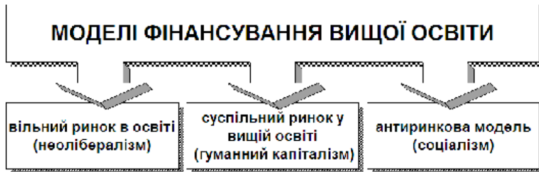
Рис. 1. Моделі фінансування вищої освіти.

З 2003 року в Австралії, згідно з Актом підтримки вищої освіти [9], розпочався новий етап реформування системи вищої освіти. Метою реформи є надання університетам доступу до фінансування, якого вони потребують для надання вищої освіти світового рівня з фокусуванням на якості навчання. Запроваджено реформу для того, щоб створити систему вищої освіти, що ґрунтуватиметься на принципах стабільності, якості, справедливості, різноманітності. Результатом реформи повинна бути лібералізована система вищої освіти, у якій провайдери вищої освіти матимуть змогу скористатися своїми перевагами та встановити ціну за свої курси, діючи у конкурентному середовищі. Для підтримки реформи австралійський уряд повинен надати близько $ 11 млрд. упродовж десяти років, починаючи з 2004 року.