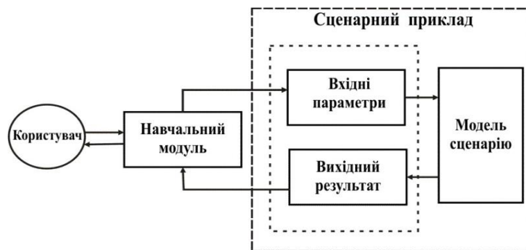
Рис. 1. Структура сценарного прикладу

Кожен сценарний приклад, використовуючи поточний стан діалогу студента із навчальною системою, формує вихідний результат (номер навчального режиму). В структурі сценарного прикладу це визначається моделлю сценарію (рис. 1.) [4].