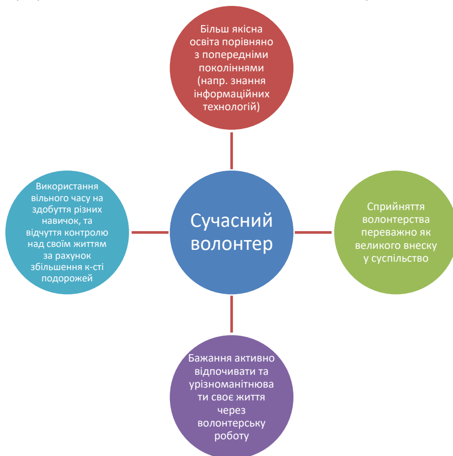
Рис. 1. Новітні характеристики та переваги сучасних волонтерів

На рисунку 1 наведемо новітні характеристики та переваги сучасних волонтерів.