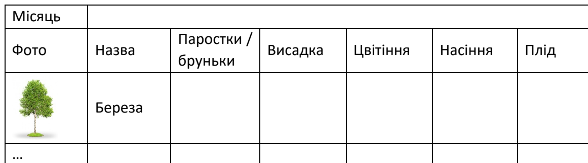
Рис. 3. Схема-модель «Календар спостережень за ростом рослин» для дітей дошкільного віку

спостереження за тією самою рослиною в різний час і робити висновки про те, як пори року впливають на рослину.