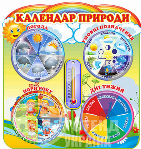
Рис. 1. Схема-модель «Календар природи» для дітей дошкільного віку

погодно-кліматичних чинників і одночасно представляє пору року з її істотно мінливими характеристиками.