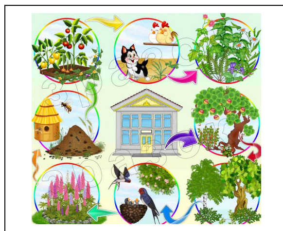
Рис. 6. Схема-модель «Екологічна стежина в закладі дошкільної освіти»

Із метою проведення навчальних екскурсій, прогулянок, масових заходів екологічно-натуралістичного спрямування, пропагандистської роботи з охорони природи для дітей організують екологічну стежину – маршрут по території закладу дошкільної освіти або ж у природних умовах. Її головна мета – виховання екологічно грамотної поведінки дітей в навколишньому природному середовищі, поширення знань про природу і людину як невід’ємну частину довкілля (Ошуркевич, 2018). Для візуалізації тематичних ділянок екологічної стежини також використовуються схеми-моделі, де виділяються зупинки і найцікавіші об’єкти для спостережень (рис. 6).