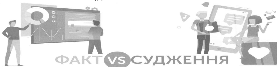
Схема 4. Факти vs судження