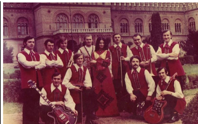
Рис. Б.2 «Червона рута»