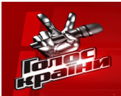
Рис. Д.1 «Голос країни»