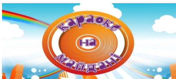
Рис. Д.3 «Караоке на майдані»