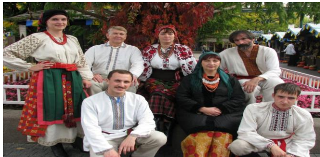
Рис. А.3 «Древо»