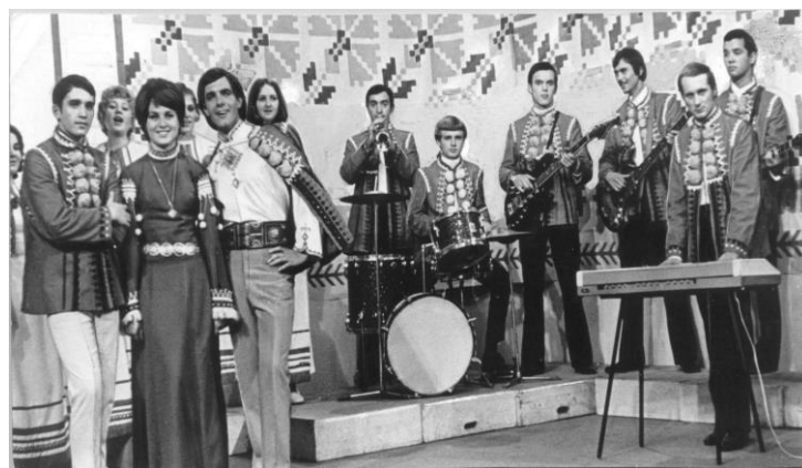
Рис. Б.3 «Смерічка»