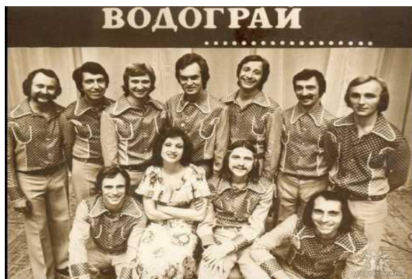
Рис. Б.1 «Водограй»