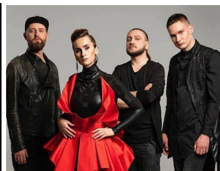
Рис. Г.3 «Go-A»