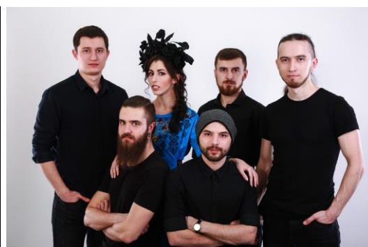
Рис. Г.8 «Mnishek»