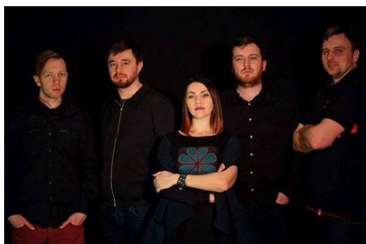
Рис. Г.7 «The Doox»