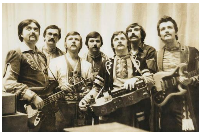
Рис. Б.4 «Кобза»