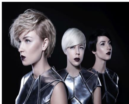
Рис. Г.2 «Onuka»