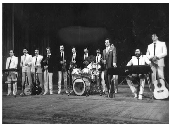
Рис. Б.5 «Світязь»