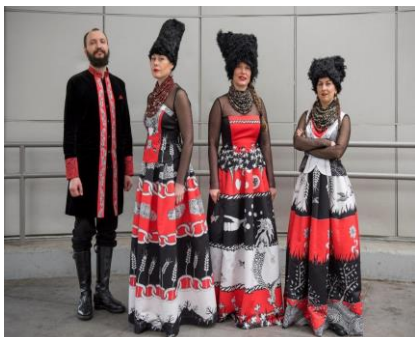
Рис. Г.1 «ДахаБраха»