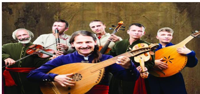
Рис. А.4 «Хорея козацька»