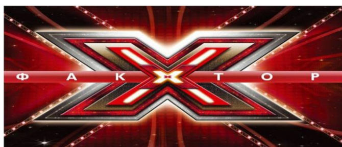
Рис. Д.2 «Х - Фактор»