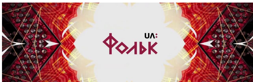
Рис. Д.4 «Фольк music»