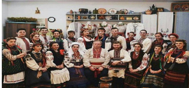
Рис. А.1 «Крالیця»