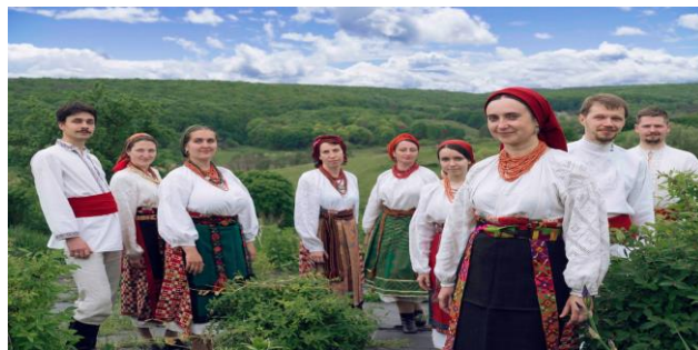
Рис. А.2 «Божичі»