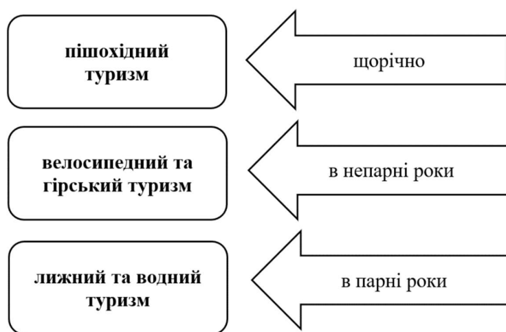
Рис. 4. Види спортивних змагань, які проводяться на Чемпіонатах України по спортивному туризму

Види спортивних змагань, які проводяться на Чемпіонатах України по спортивному туризму представлені на рис. 4.