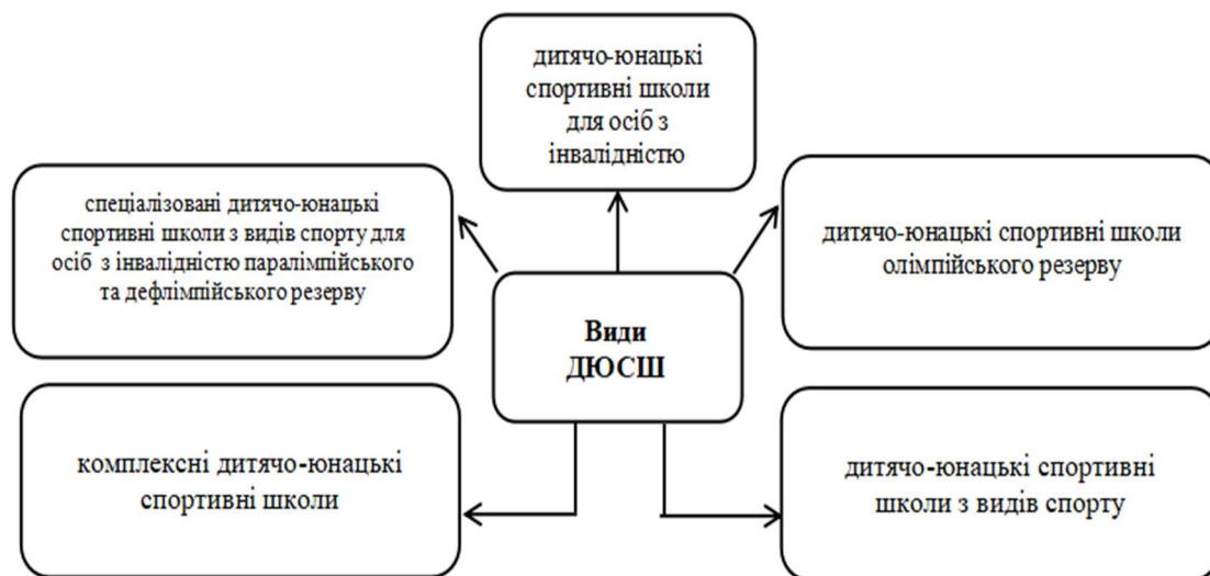
Рис. 2. Види дитячо-юнацьких спортивних шкіл

вихованців, учнів і слухачів з урахуванням їх віку, психофізичних особливостей, стану здоров'я);