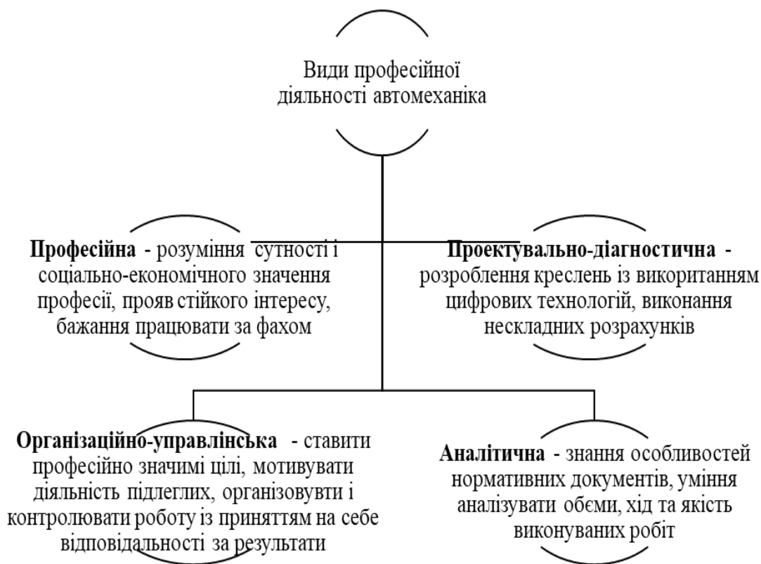
Рис. 1. Основні види професійної діяльності автомеханіка

Провівши аналіз професійних завдань, які автомеханік за фахом «Обслуговування та ремонт автомобілів і двигунів» повинен вирішувати, відзначимо, що функціональна модель практико-орієнтованого навчання повинна будуватися з урахуванням таких основних напрямів професійної діяльності автомеханіка: професійний, проектувальний, організаційно-управлінський, аналітичний (рис. 1).