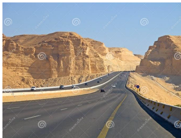
Рис.3. Дорога Ганді 3

Практично усі державні діячі Ізраїлю пройшли через службу в лавах ЦАХАЛ (Сили оборони Ізраїлю), де часто їх знали за псевдо (зараз і в Збройних силах України існує така практика серед військових, які воюють на Сході та Півдні з російським агресором). Ставши політиками, ізраїльські діячі були не проти, щоб їх називали за їхніми військовими псевдо. Так от, «Шосе Ганді» названо на честь Рехавама Зееві (1926-2001 рр.) – відомого ізраїльського військового, генерал-майора у відставці, а пізніше – міністра туризму Ізраїлю (2001 р.). У своїй діяльності він нічого спільного з індійським Ганді не мав, скоріше навпаки: за життя він зарекомендував себе, як людина рішуча, а його погляди та підходи до вирішення проблем не завжди однозначно сприймалися в ізраїльському суспільстві. Так, його партія «Моледет» належала до суперправих та виступала за переселення арабського населення з Іудеї, Самарії і сектора Гази «за їхнім власним бажанням» кудись в інші місця, що викликало нерозуміння і протести навіть у самому Ізраїлі, не кажучи вже про арабські країни та світову спільноту. 17 жовтня 2001 р. Р.Зееві загинув внаслідок замаху на нього