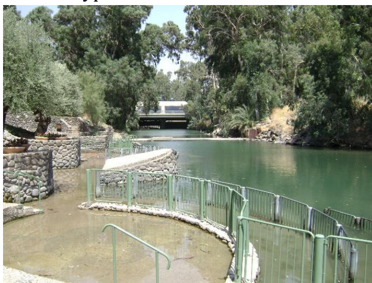
Рис.4. Купальня у Йорданії 12

приємне, особливо після подорожі пустелями півдня країни: тут є і невелика річка з лісом на її берегах, і зухвалі нутрії, що випрошують корм у туристів (рис.4). Але історики і богослови впевнені, що ця видатна подія відбувалася значно південніше, при впадінні річки у Мертве море – в Каср-ель-Яхуд (на кордоні Ізраїлю та Йорданії). Сьогодні тут теж є купальні. Куди їхати – вирішувати самим туристам.