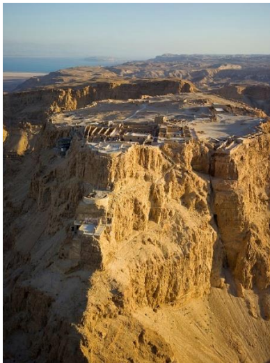
Рис. 7. Фортеця Масада 10

стежинка; з заходу до фортечних мурів можна дістатися по штучному насипу, збудованому ще давніми римлянами під час останньої облоги. Історія облоги Масади стала відома світу від іудейського історика Йосипа Флавія. Довгий час її вважали легендою і лише після майже двотисячолітнього забуття були знайдені залишки фортеці і здобуті докази її героїчного минулого. А порівняння давньоримських та іудейських писемних джерел остаточно підтвердило історію, записану Флавієм. Руїни фортеці були виявлені 1862 р., але повноцінні археологічні розкопки у Масаді були здійснені тільки в 1963-1965 рр. під керівництвом відомого ізраїльського вченого Ікала Ядіна, коли була розчищена майже вся забудована частина скелі і здійснена часткова реконструкція давніх споруд. У 1971 р. Масаду зв'язала з «великою землею» канатна дорога і цитадель стала доступною для масового туризму.