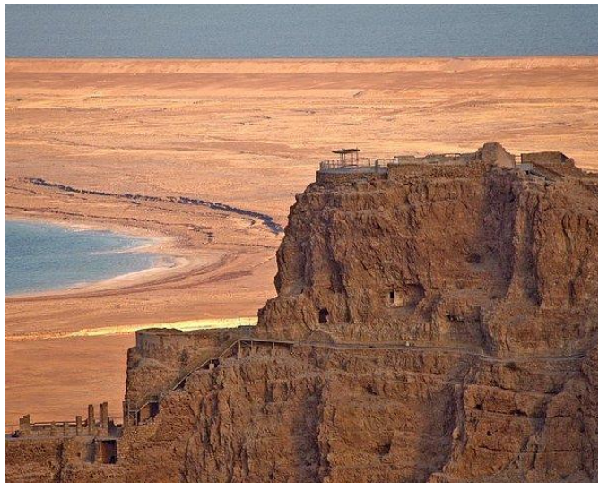
Рис. 8. Три яруси царського палацу у Масаді

відпочинку. Крім цього для Ірода збудували царську резиденцію у західній частині фортеці. Ця будівля площею біля 4 тис м 2 включала десятки приміщень і була доповнена чотирма 27-метровими баштами. У південно-східній частині будинку знаходились особисті покої царя, розміщені по периметру прямокутного внутрішнього двору, серед них була велика зала для прийомів з чудовою мозаїчною підлогою. У північно-східній частині будинку розміщувались майстерні, у південно-західній – склади, а у північно-західній – службові кімнати. Три невеликі багато декоровані палаци, що знаходились біля, належали членам родини Ірода. Біля одного з цих палаців знаходився великий басейн, а на південь від північного палацу – велика лазня у римському стилі. Вся інша площа плато була засипана шаром родючого ґрунту і віддана під посіви та невелике пасовище, щоб у випадку облоги гарнізон міг поповнювати свої припаси. Крім того, посеред західного схилу, яким теж могли б піднятися нападаючі, була зведена оборонна башта. У такий спосіб за допомогою запрошених давньоримських інженерів була збудована практично неприступна цитадель.