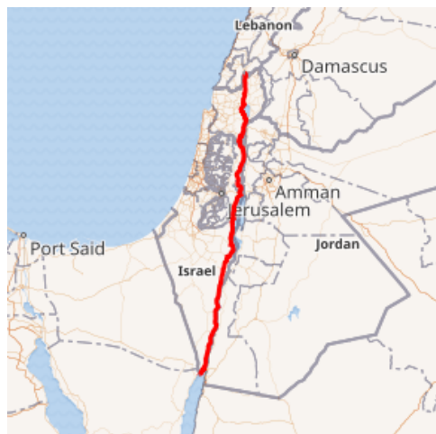
Рис.2. Шосе 90 (Дорога Ганді) 4

арабських сусідів, що є нині актуальним і для України в умовах повномасштабної російської агресії.