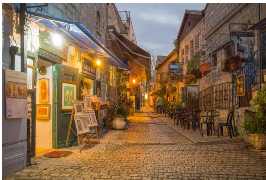
Рис.6. Місто Цфат 8

кабалізму – містичної течії іудаїзму. Можливо, про кабалу і знали би тільки посвячені та невелике число допитливих. Але, завдяки тому, що до кабали проявили цікавість і, навіть, любов поп-зірки світового рівня «широко відоме у вузьких колах» езотеричне вчення і отримало світову популярність. За декілька годин, які турист проведе у Цфаті, він не побачить нічого містичного, зате напевно оцінить місцеві краєвиди (за погожих днів звідси можна побачити і озеро Кінерет і вершину гори Хеврон, на якій може лежати сніг) і квартали міста, що зайняті творчою спільнотою – художниками і скульпторами. А у якості місцевого сувеніру рекомендується придбати головку місцевого сиру, що за смаком нагадує несолону бринзу.