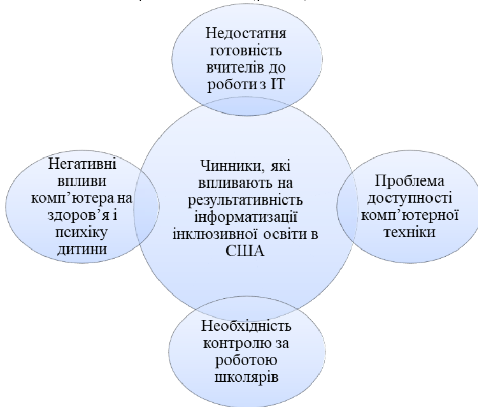
Рис.1. Чинники, які впливають на результативність інформатизації інклюзивної освіти в США

Аналіз досвіду впровадження ІТ в освіту дітей з інтелектуальними порушеннями в США дозволив виявити позитивні сторони такого підходу до навчання й певні проблеми, які знижують результативність процесу інформатизації освіти в країні загалом (рис. 1).