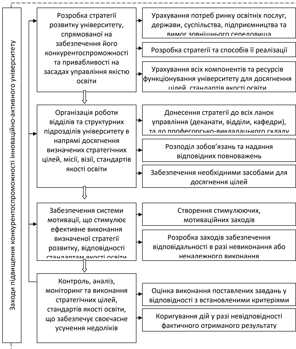
Рис. 3. Заходи підвищення конкурентоспроможності та привабливості інноваційно-активного університету на засадах управління якістю освіти (авторська розробка)

вузькому – про управління конкурентоспроможністю та привабливістю університету на засадах забезпечення якості освіти.