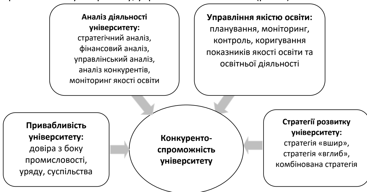
Рис. 2. Складові формування високої конкурентоспроможності інноваційно-активного університету (авторська розробка)

Формулою високої конкурентоспроможності інноваційно-активного університету є співвідношення таких компонентів як аналіз, стратегія та привабливість університету, управління якістю освіти (рис. 2).