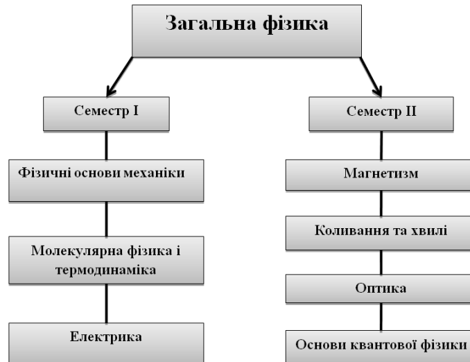
Рис. 1. Структура курсу загальної фізики

Для прикладу, на рис. 1 представлено структуру курсу загальної фізики, який читається студентам першого курсу НТУ, що навчаються за спеціальністю 131 «Прикладна механіка» (Іщенко, 2019). З рис. 1 видно, які розділи фізики розглядаються в першому семестрі, які – в другому. Необхідно зазначити, що в першому семестрі підсумковий контроль проводиться у вигляді заліку, в другому – екзамену.