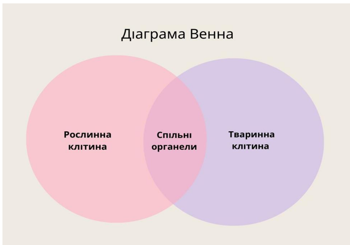
Рис 3.2. Діаграма Венна

бачити подібності та відмінності, виявляти логічні зв'язки. Перетин кіл позначає спільні характеристики, а решта – відмінності. Наприклад, учням пропонується завдання «порівняйте будову тваринної і рослинної клітини, визначивши спільні та відмінні органели, заповніть діаграму Венна» (рис. 3.2).