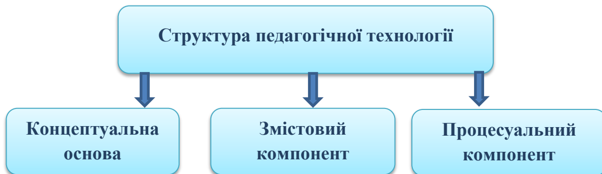
Рис. 1.1. Структура педагогічної технології

Узагальнюючи різні підходи можна зробити висновок, що педагогічна технологія – це система форм, методів, засобів, принципів, що регулюють процес досягнення освітньої мети, а структура цієї системи складається з концептуального, змістового та процесуального компонентів (рис. 1.1):